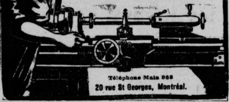
Téléphone Main 988 20 rue St Georges, Montréal.

Ingénieurs et Machinistes SPECIALITES: Engins à Vapeur, à Gaz, à Gazoline, Pompes, Moulins à Vent, Machines à Bois, Machines à Imprimer, Ouvrage Mécanique Général.