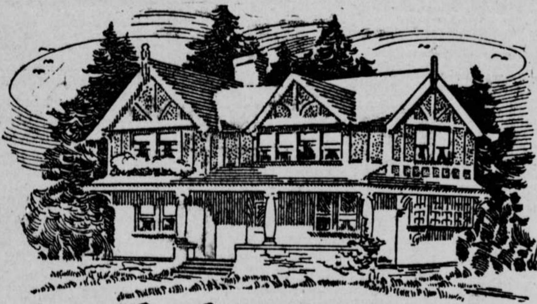
- CLYDE S. ADAMS - ARCHITECT -