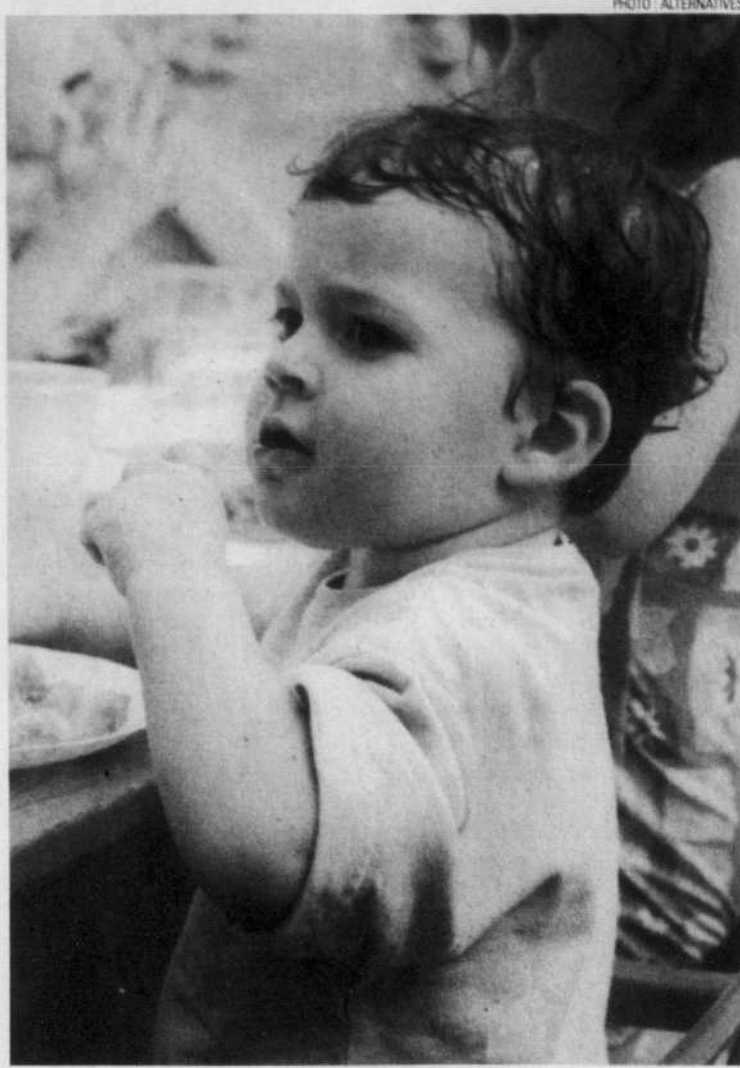
Le réseau des centres de la petite enfance accueillait 146 600 enfants en 2002.

En vertu de la loi 32, le gouvernement peut maintenant retirer des places accordées à un CPE pour les attribuer ailleurs, au public ou au privé, dans le cas où la création de nouvelles places ne respecterait pas le délai déterminé ou lorsque ces dernières seraient inoccupées.