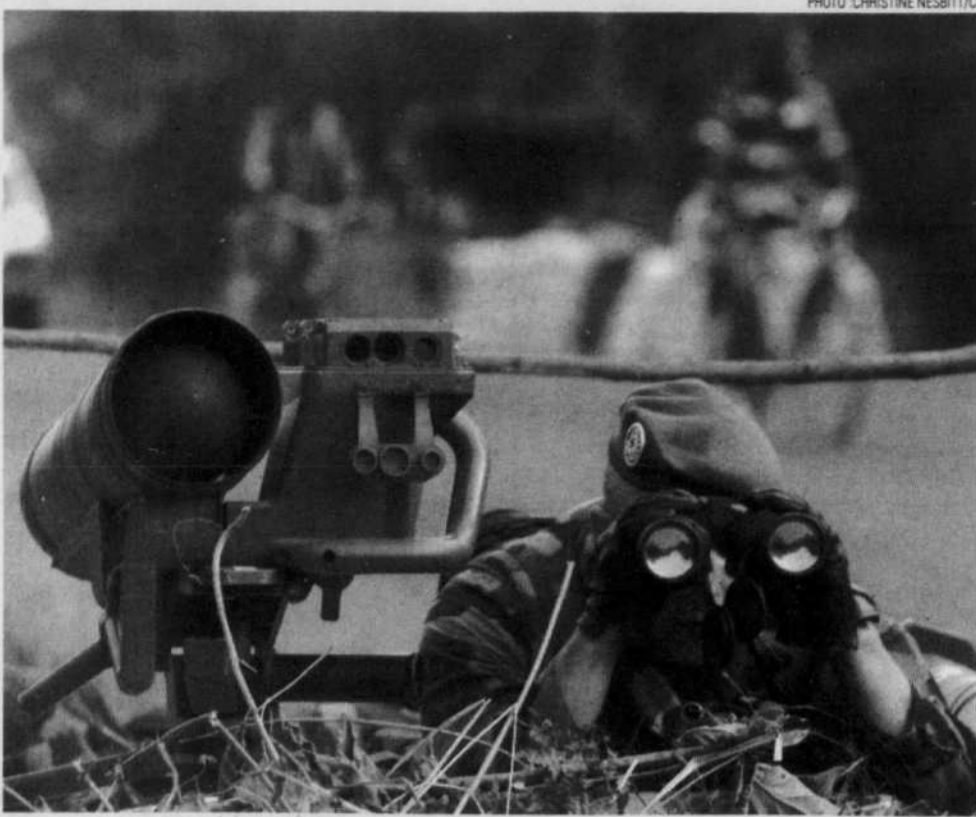
Un soldat des Forces françaises, qui ont rapidement instauré une zone démilitarisée divisant la Côte d'Ivoire en deux, après la tentative de coup d'État de septembre 2002, surveille la route menant à Man, ville située dans l'ouest du pays.

Cette montée de l'intolérance envers les immigrants burkinabés, maliens et guinéens aura également un impact sur les Ivoiriens du nord, dont les patronymes et la langue sont souvent les mêmes que les immigrants.