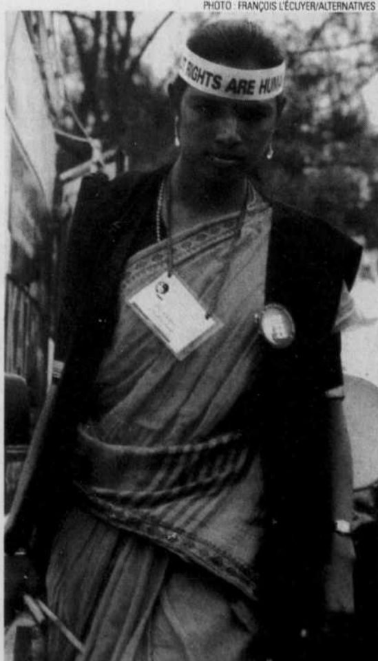
Les « dalits » (intouchables ou hors castes), constituent 17 % de la population indienne, soit environ 170 millions de personnes.

Les auteurs sont respectivement stagiaire du programme Furetez dans le monde et directeur d'Alternatives.