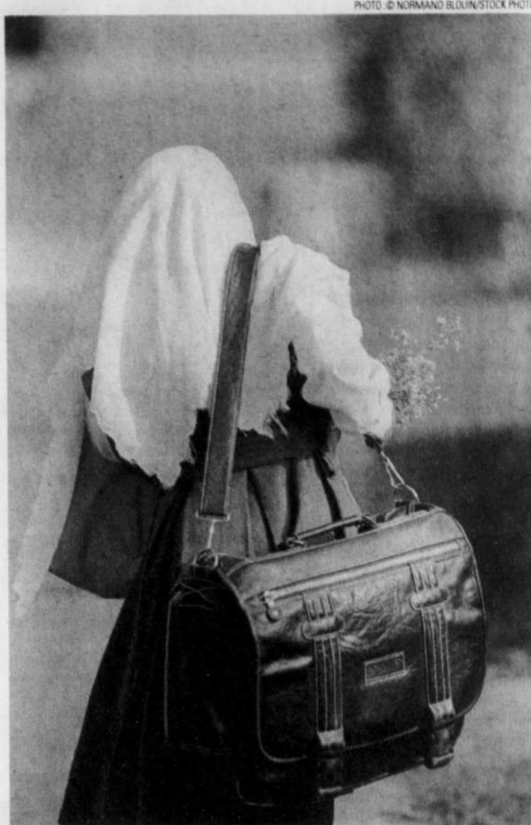
L'islam est la deuxième religion en importance en France.