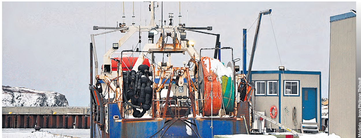
Les quotas de crevette ne seront que de 3060 tonnes pour 2024.

Pour les allocations, la part du lion revient à la flotte d'engins mobiles hauturiers, soit des navires de plus de 100 pieds, qui obtient 58,7% des quotas. La flotte côtière d'engins mobiles, avec ses navires de moins de 65 pieds, reçoit 14,9% des