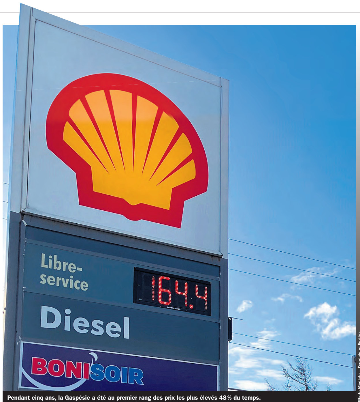
Pendant cinq ans, la Gaspésie a été au premier rang des prix les plus élevés 48% du temps.

En tenant compte de la valeur des coûts d'exploitation, les marges de détail nettes sont plus élevées dans la région de la Gaspésie que dans l'ensemble du Québec, avec un écart de 3,9 cents/litre en moyenne.