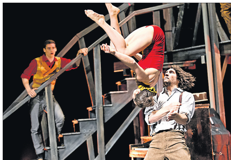
Qui dit cirque dit, immanquablement, acrobaties.

Voguant à travers l'évolution du cirque et la multiplication des troupes, le Cirque Éloize tient aux deux mots-clés à la base de sa direction artistique: impressionner et toucher. «On veut toujours que ce soit accessible, très impressionnant acrobatiquement, et on veut toucher le spectateur. On va toujours rester dans l'humanité, dans la proximité», conclut M. Painchaud.