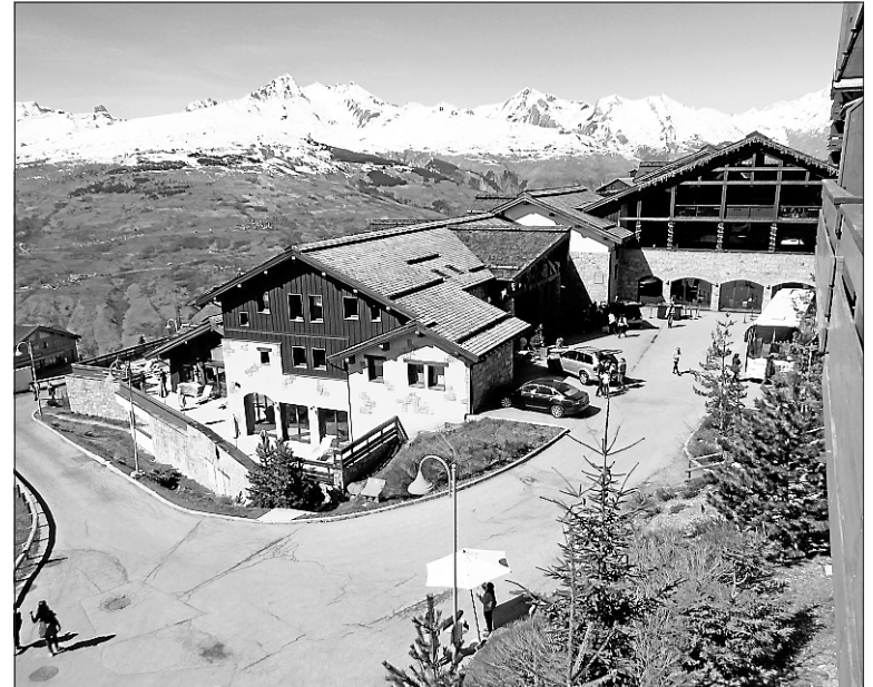
Le Club Med de Peisey-Vallandry a des allures d'immense chalet de ski.

Bien sûr, on voudra se goinfrer dans le bar à tartes, beaucoup trop délicieusement disposé, ou