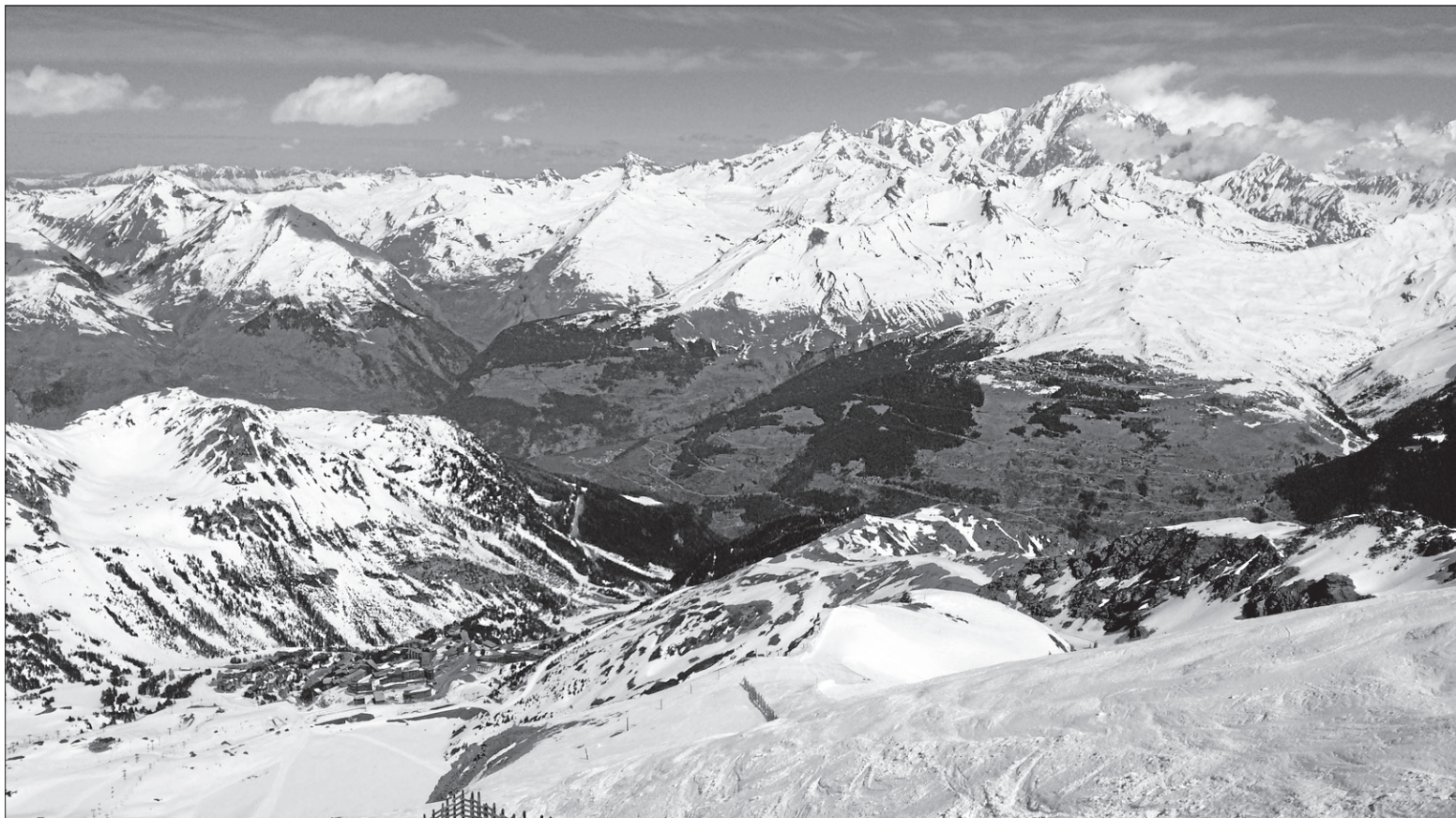
La vue de l'Aiguille rouge, à plus de 3000 mètres d'altitude.