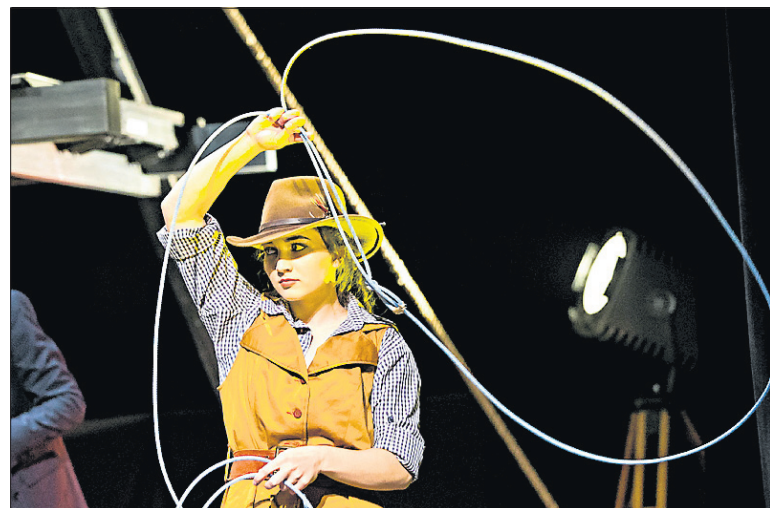
Le lasso est évidemment présent dans Saloon.