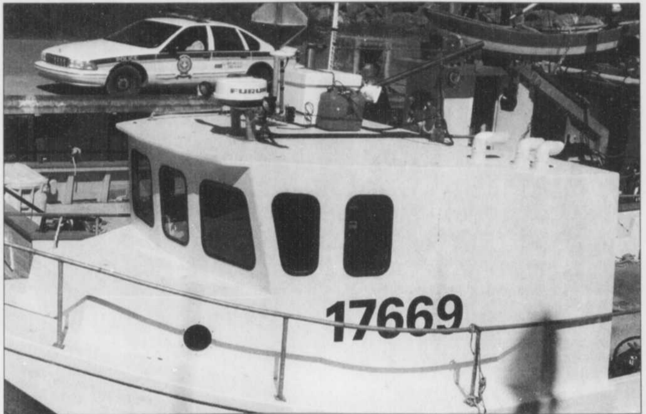
La police s'explique mal comment l'employé de la compagnie Biorex a pu tomber de ce bateau de pêche. Mais pour l'instant, on refuse de parler d'un acte criminel.

Le camp abrite, jusqu'à dimanche, 433 cadets, 64 officiers, 30 militaires et autant de civils. Le respect mutuel est une des valeurs véhiculées par les autorités locales.