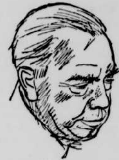
J. B. Priestley

Depuis, plusieurs de ces jeunes artistes ont chanté avec des orchestres symphoniques canadiens et des troupes d'opéra. Le public les suit, de succès en succès, heureux d'applaudir des talents canadiens authentiques.