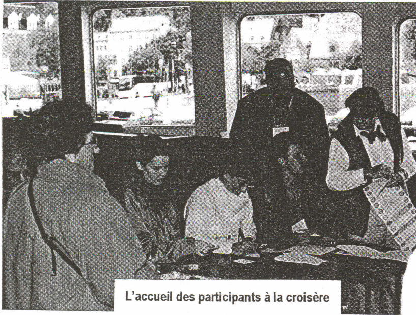
L'accueil des participants à la croisière