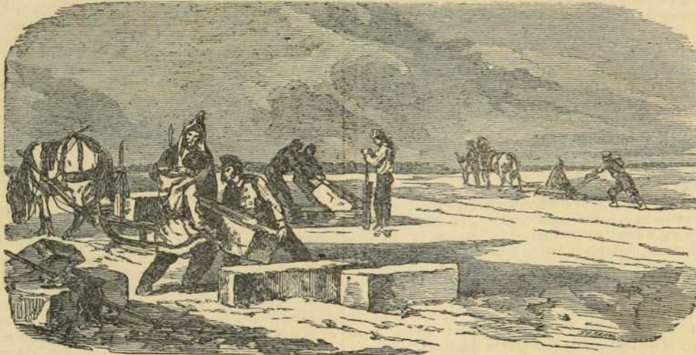
Les Scieurs de glace sur le St. Laurent.

Le Saint-Laurent est magnifique durant la belle saison; ses deux rives ne forment qu'une longue rue garnie de maisons qui ne sont séparées que par des jardins et des bouquets de bois, elles sont généralement hautes sans être escarpées et d'un aspect aussi riant que majestueux. La navigation fluviale se distingue par son acti-