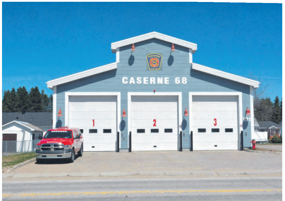
La caserne de pompiers de Sacré-Cœur est au cœur d'un projet de rénovation et d'agrandissement afin de se conformer aux normes de la CNESST.

« Le montant de la subvention n'est pas encore déterminé, mais le programme participera au projet à la hauteur de 65 % du montant admissible », précise le directeur général. La Municipalité cumule donc un manque à gagner d'environ 70 000 $.