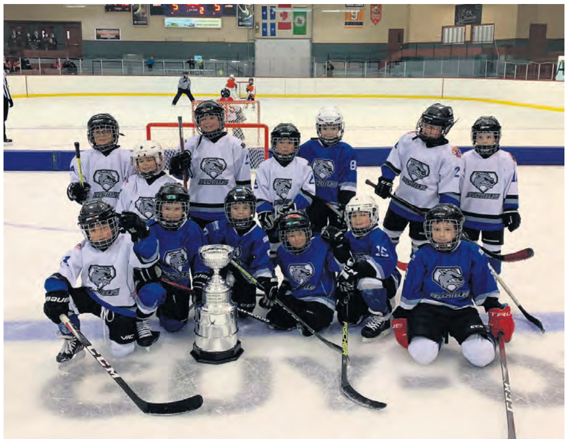
Les Prédateurs de la Haute-Côte-Nord ont terminé en troisième position du classement dans le niveau 2 alors qu'ils ont vaincu les Rorquals Pointco de Charlevoix 10 à 1.