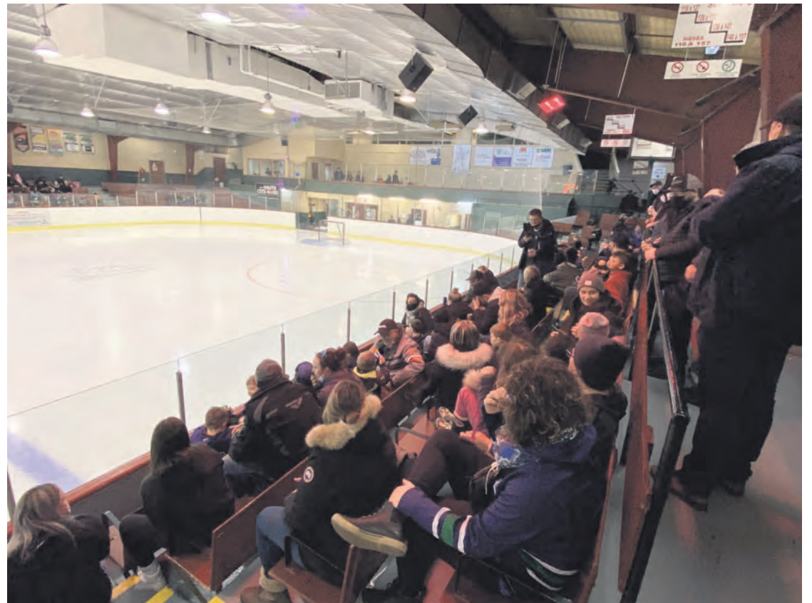
Les gradins du Complexe Guy-Ouellet étaient remplis toute la fin de semaine pour encourager les joueurs novices en provenance de la Côte-Nord et de Charlevoix.

Au niveau 2, les joueurs de Baie-Comeau ont réussi à marquer trois fois comparativement à une fois pour les Black Hawks de Sept-Îles.