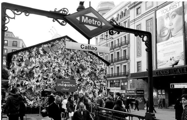
Bidons en plastique, pneus et livres pour enfants s'entassent sur les murs du «premier hôtel poubelle du monde», une œuvre artistique qui souhaite mettre au jour la face cachée du tourisme de masse.

L'artiste et son équipe sont partis à la recherche d'objets abandonnés sur les plages de France, de Grande-Bretagne, d'Allema-