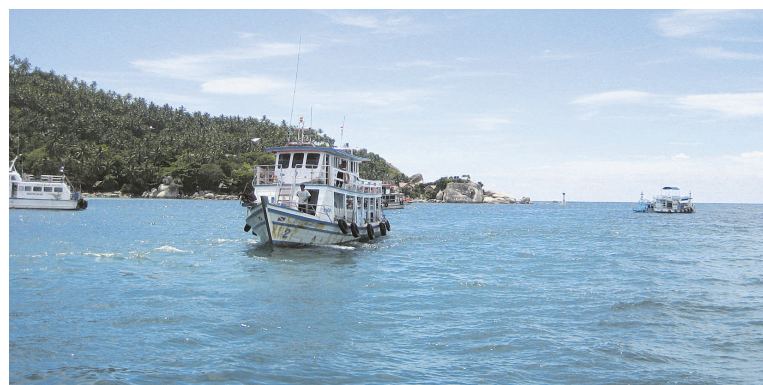
Bateau de plongée

Au belvédère, un réseau de passerelles relie les immenses roches battues par l'eau cristalline. On peut se baigner et faire de la plongée libre juste en bas, où l'on peut même voir les poissons hors de l'eau. Lorsque nous sommes passés en octobre, l'endroit était très peu achalandé. Et les boissons rafraîchissantes à peine plus chères qu'au village.