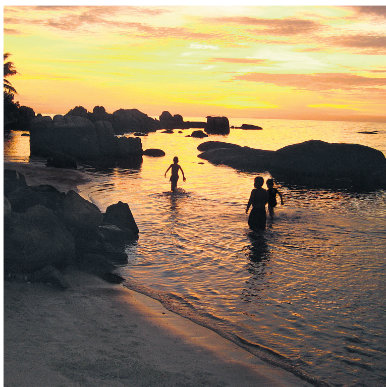
La plage de Sairee est la plus populaire de l'île.

Il ne faut toutefois pas oublier de s'offrir une pancake thaïe, faite par les artisans qui s'installent avec leur chariot-cuisinière le long de la route. La pâte se situe entre celles d'une pizza et d'une crêpe et la version la plus populaire est farcie avec bananes et Nutella, coupée en carrés et arrosée de lait concentré sucré. Elle est prisee par les adeptes du nightlife . Certains pancake men ont même atteint le statut de légende sur YouTube et Facebook! Le Soleil