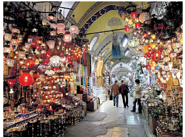
Le Grand Bazar d'Istanbul. Alors que l'ensemble de la Turquie a reçu plus de touristes en 2010, la ville d'Istanbul, elle, a vu le nombre de visiteurs étrangers chuter de 7,31 %.

ISTANBUL — L'accession d'Istanbul au titre de Capitale européenne de la culture 2010 n'a pas porté ses fruits en matière d'attraction de touristes étrangers, leur nombre ayant même baissé de 7,31 % par rapport à l'année précédente, ont affirmé mercredi des professionnels du secteur. Alors que le nombre d'entrées de visiteurs étrangers en Turquie a progressé de 5,23 %, à 28,49 millions, il a régressé de 7,31 % à Istanbul, pour atteindre 6,96 millions, a annoncé le président de la Fédération des hôteliers de Turquie (TÜROFED). La ville espérait attirer, avec quelque 520 événements culturels et restaurations de monuments historiques, jusqu'à 10 millions de touristes étrangers, contre 7,5 millions en