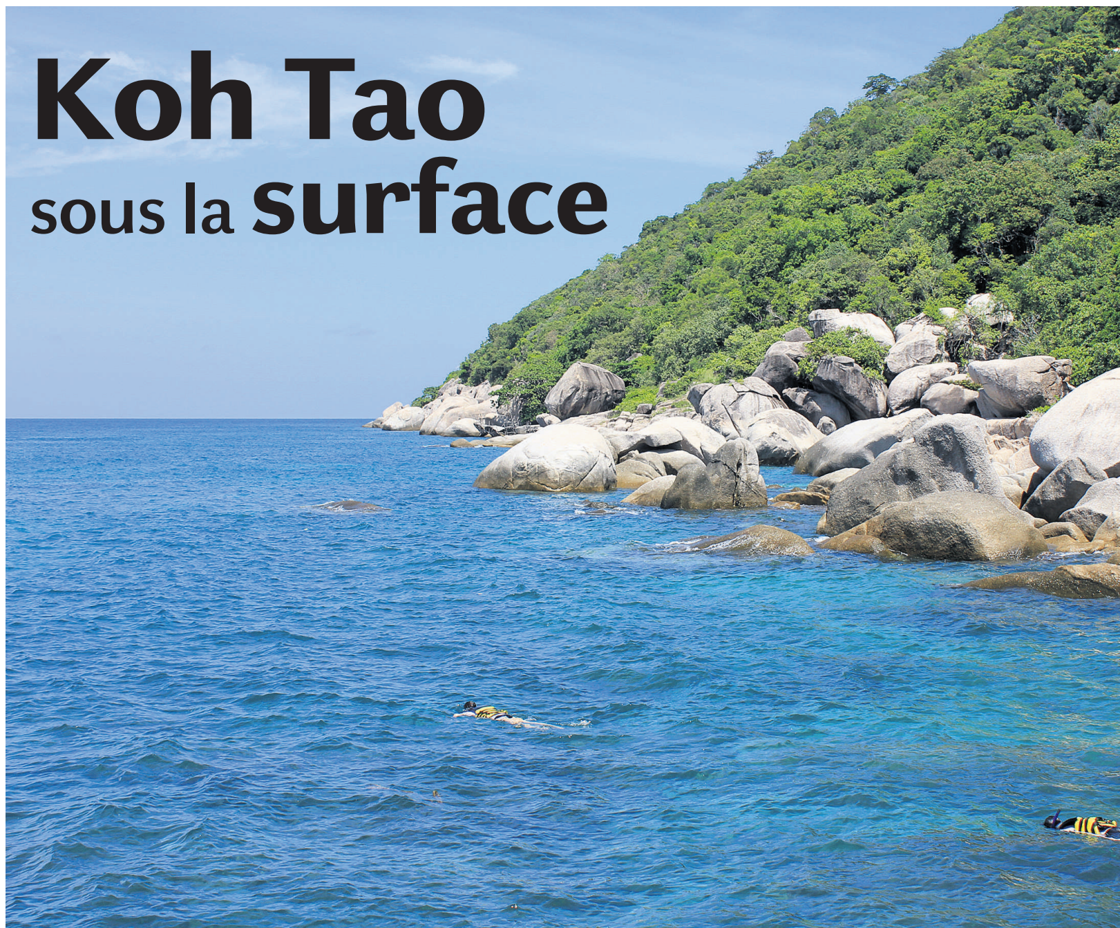
La vue à partir du belvédère de Nangyuan Terrace vaut vraiment le détour. En prime, on peut se baigner et faire de la plongée libre juste en bas. — PHOTOS

En fait, certains déplorent que Koh Tao soit devenu une «usine à bulles». Mieux vaut donc avoir une petite idée de ce que vous cherchez avant de vous diriger vers l'île, car les vendeurs s'attaquent aux futurs clients directement dans les navettes menant à Koh Tao. Et ils n'hésitent souvent