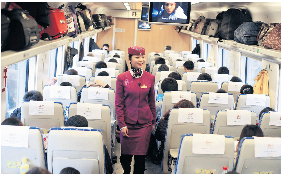
Un train à grande vitesse reliant Pékin à Chongqing a été inauguré la semaine dernière. Le gouvernement chinois affirme que son TGV nouvelle génération, qui reliera Pékin à Shanghai en quatre heures (plutôt que 10 heures), sera en service dès le mois de juin.

Depuis décembre 2009, le train le plus rapide du monde — made in China — circule à 350 km/h