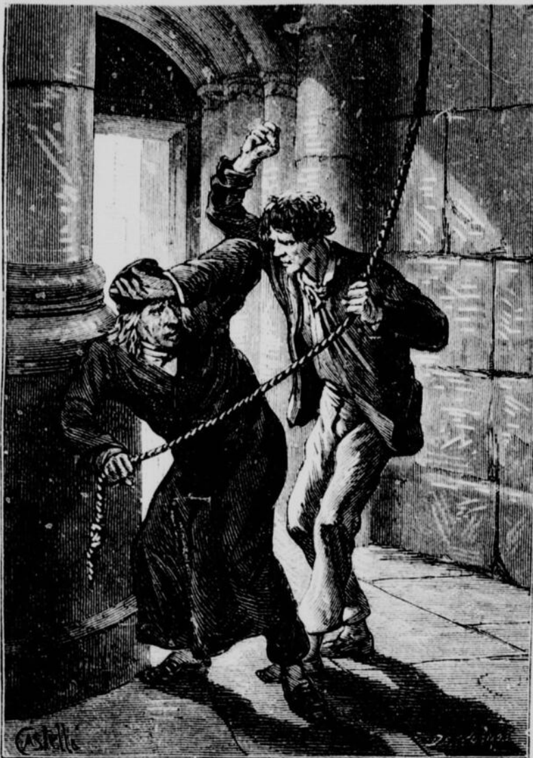
Il a trappé notre vieux sacristain. (Voir page 6.)

—Bah ! monsieur le curé, il vous faut bien une soutane de temps en temps.