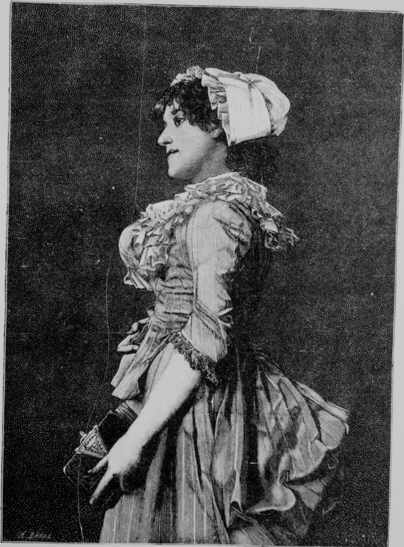
UNE VILLAGEOISE, tableau de M. J. Goupil.

ABONNEMENTS : Six mois : $1.50 — Un an : $3.00