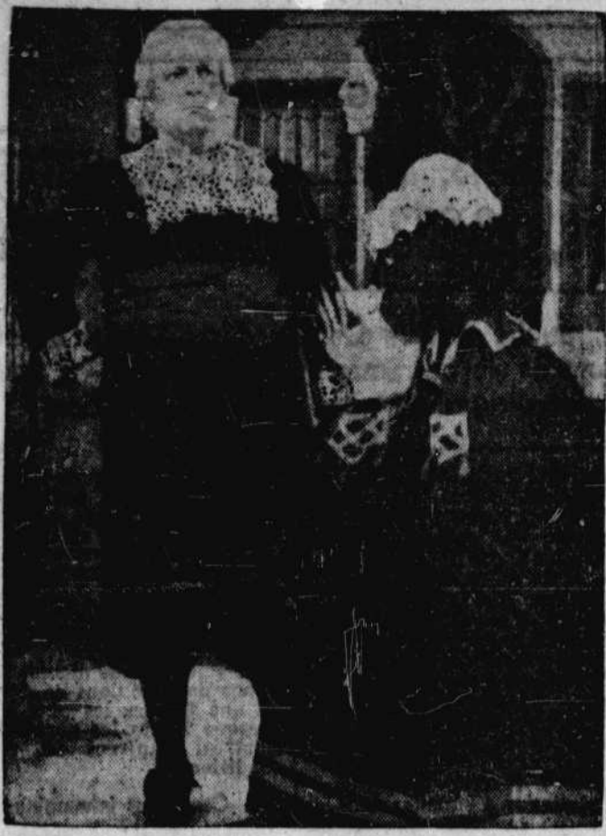
Le Cinéma de Paris met aujourd'hui à l'affiche l'opéra-comique de Beaumarchais "Le Barbier de Séville", dans lequel on peut voir et entendre pour la première fois, dans une interprétation extraordinaire, les artistes, les chœurs et le grand orchestre de l'Opéra-Comique de Paris.