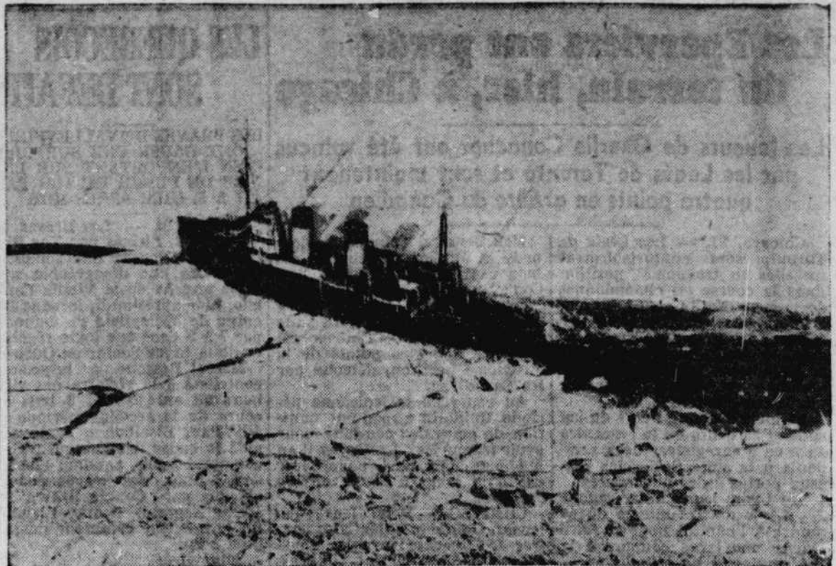
On voit ici le brise-glace fédéral "N.B. McLean" s'écarter de l'épave contre un embâcle de glace près des Trpis-Rivières, dans ses efforts, avec l'"Ernest Lapointe" pour ouvrir un chenal à la navigation sur le fleuve Saint-Laurent. Si la belle température se maintient, ces deux navires attendront peut-être le port de Montréal à la date la plus hâtive encore vue dans nos annales.

POUR LA PROCHAINE OUVERTURE DE LA NAVIGATION