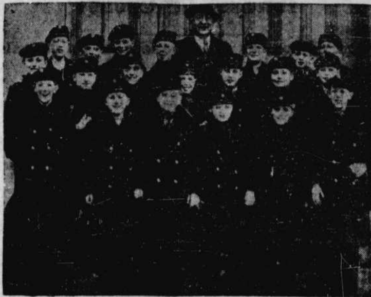
Les Petits Chanteurs de Vienne, qui donneront, en exclusivité à Montréal, un concert à l'auditorium du collège de Saint-Laurent, le 28 février prochain, sous les auspices de la société PROSPERO.

LES PETITS CHANTEURS DE VIENNE A SAINT-LAURENT