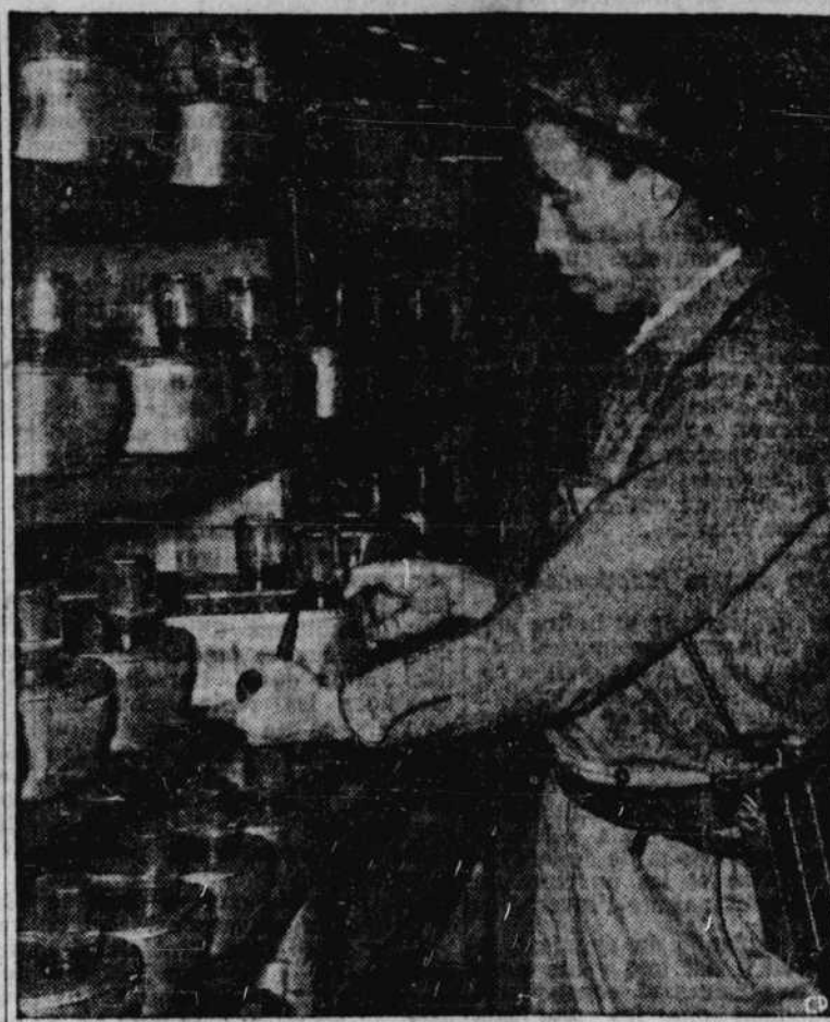
Ces rangées de petites cages à tiroirs servent à loger 500 souris blanches, à 2,000 pieds sous terre, dans la mine McIntyre-Porcupine, près de Timmins, en Ontario. Elles aident à déterminer si les rayons cosmiques ont vraiment quelque influence sur le développement des tumeurs cancéreuses. La science moderne pense en effet que ces rayons, provenant de la voûte céleste, n'ont guère d'influence dans les profondeurs du sol. Pour contrôler cette opinion, on a placé un groupe semblable de ces petits animaux dans un laboratoire de Toronto où ils sont exposés aux radiations solaires normales.