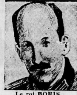
Le roi BORIS

La démission du premier ministre est dû à sa lutte avec le ministre de l'Agriculture, Ivan Bogranoff, au sujet des relations de la Bulgarie avec la Russie soviétique. Bogranoff était un membre très populaire dans le gouvernement de Kiosseivanoff et il favorisait, dit-on, des relations plus étroites avec Moscou. On rapporte aussi que les deux hommes ne s'entendaient pas toujours sur la question de politique intérieure. Bogranoff voulait un retour aux principes démocratiques et au parlemen-