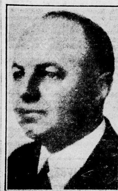
M. MITCHELL HEPBURN, premier ministre d'Ontario et trésorier provincial.

Conjectures sur l'accueil que lui feront les quatre grandes puissances de l'ouest.