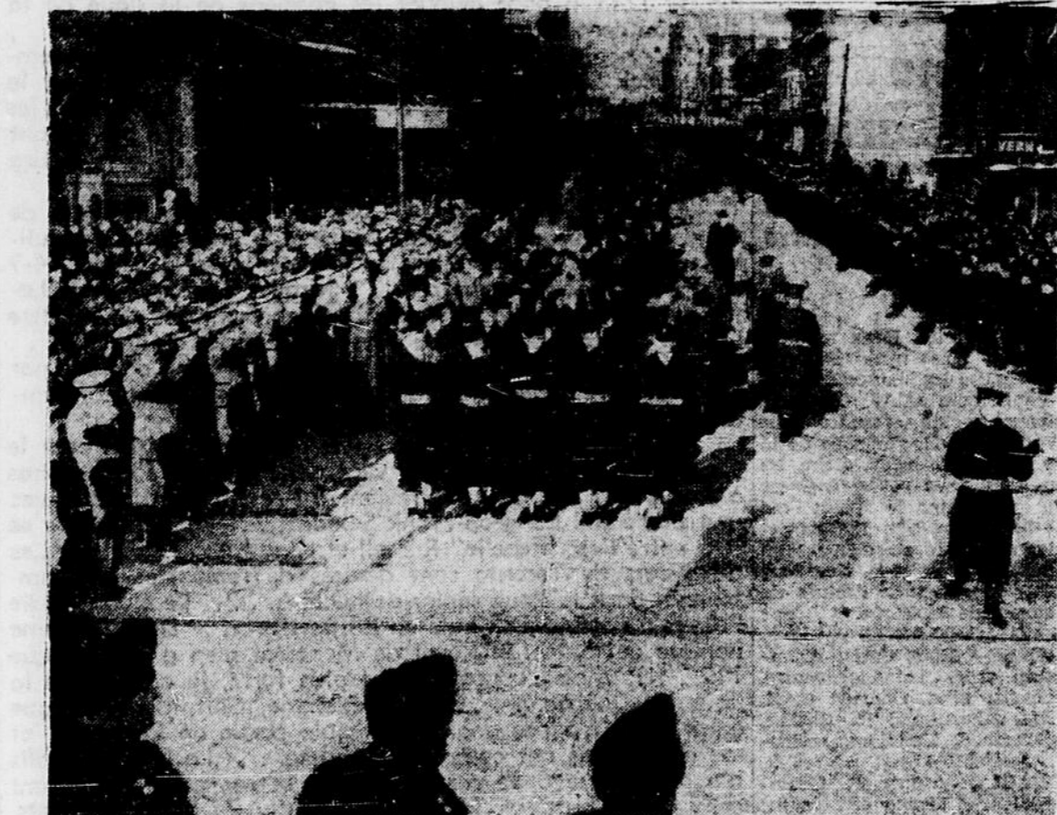
Ce sont des soldats de réserve qui transportaient le corps de Lord Tweedsmuir à la gare à Montréal, d'où un convoi le porta à Ottawa pour les funérailles d'Etat. Trois fanfares marchaient dans la procession, mais il n'y eut pas de musique.