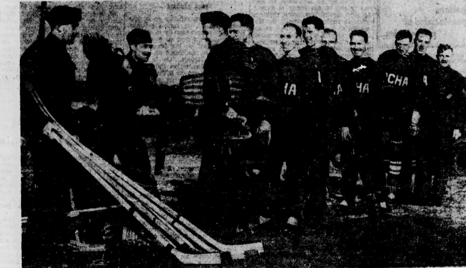
Grâce à la générosité d'un Canadien à Londres, nos soldats de la première division ont pu s'équiper et former une redoutable équipe de hockey, qui livra deux émouvantes parties à Wembley, contre les Lions et les Monarchs.