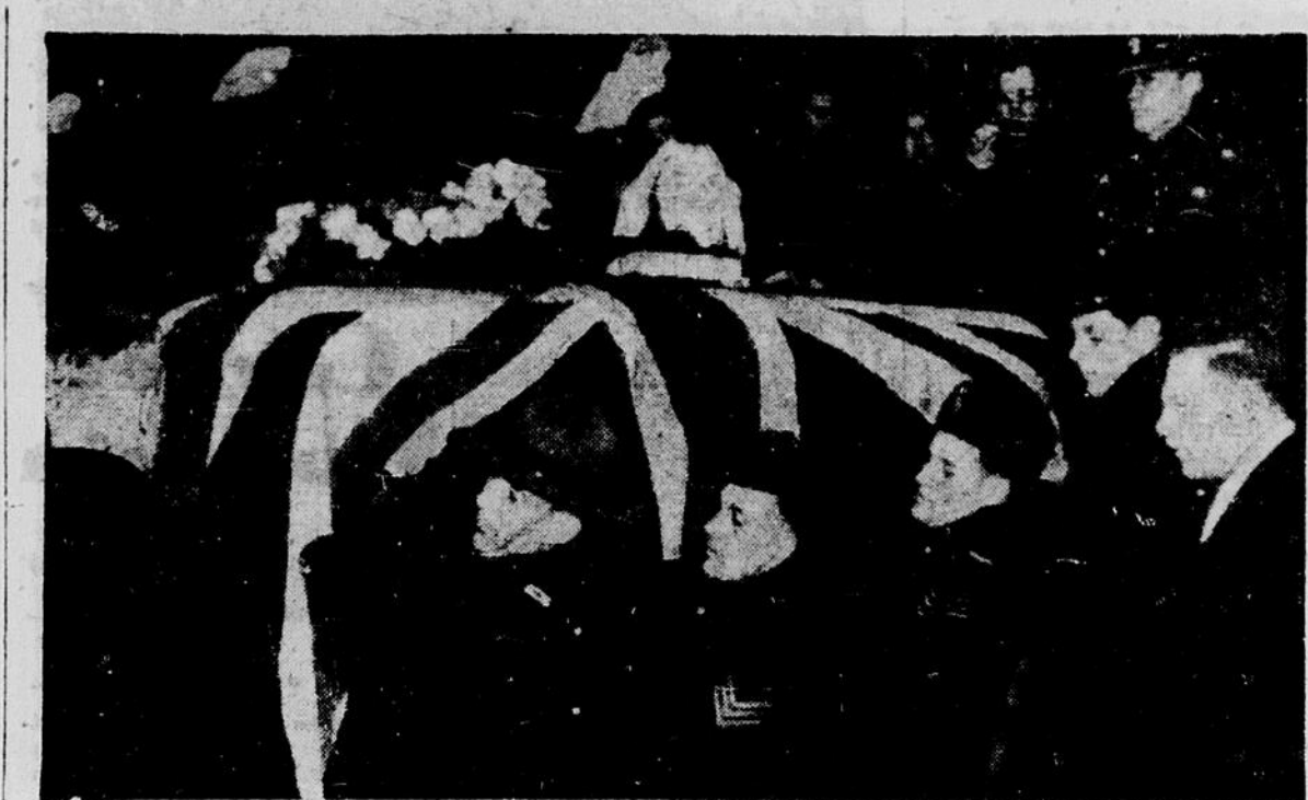
Des milliers de citoyens de la capitale se pressaient sur les rues pour voir le cortège imposant qui accompagnait le corps de Lord Tweedsmuir hier. On voit ici le cercueil portant les restes du gouverneur général, au sortir de l'église Saint-André, où fut célébré le service. De l'église, le corps fut transporté à Montréal pour la crémation, et de là, les cendres seront portées en Angleterre pour l'inhumation probablement au cimetière de Pebles-Shire.

De Kerillis a fait une liste de 30 des principaux agents hitlériens "découverts en France en 1939 jusqu'au commencement de la guerre. Il y en a beaucoup d'autres, dit-il.