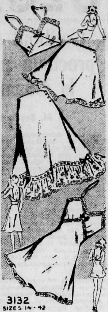
3132 SIZE 5 14-42

Adressez vos commandes au Service des Modes Journal "Le Droit". N°: avons maintenant le nouveau catalogue d'automne et d'hiver.