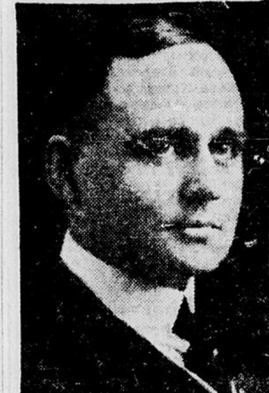
L'HON. PIERRE CASGRAIN

électorales après avoir rendu un hommage suprême à Lord Tweedsmuir par les funérailles d'Etat les plus impressionnantes dans ses annales.