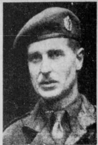
A sa retraite — Le lieutenant-colonel Lord Tweedsmuir, O.B.E., 33 ans, d'Ortawa, qui se retire de l'armée active.

PARIS, 12. (Par Maurice Desjardins, de la P.C.). — Les deux grandes questions du jour à Paris (il y en a de plus petites) sont: A: peut-on vaincre le marché noir? et B: peut-on vivre honnêtement aujourd'hui? Ah! ce marché noir, on a toujours bien en vie, comme la moitié du ver de terre que l'on coupe en deux.