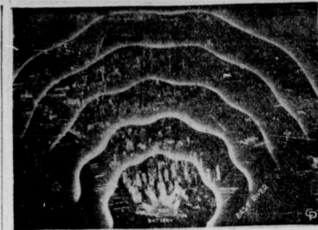
Une idée de la bombe atomique — On peut avoir une idée des effets de la nouvelle bombe atomique en considérant cette photo de l'île Manhattan, à New-York. En supposant qu'une bombe atteindrait la Battery, à l'extrémité sud de l'île, et que les vagues de destruction s'étendraient vers le nord seulement, la vie serait réduite en poussière jusqu'aux Polo Grounds, à la 155e rue. Les gens qui habitent cette région seraient tués, blessés ou sans foyer.

TCHOUNG-KING, 10. (P.A.). — Le général Albert Wedemeyer a déclaré au cours d'une conférence de presse qu'on songe sérieusement à employer des bombes atomiques sur le théâtre de guerre chinois, surtout où les résistances militaires s'exagèrent. Le général Wedemeyer commandant des forces américaines en Chine, a mentionné particulièrement Shanghai, sous occupation japonaise, comme cible militaire éventuelle.