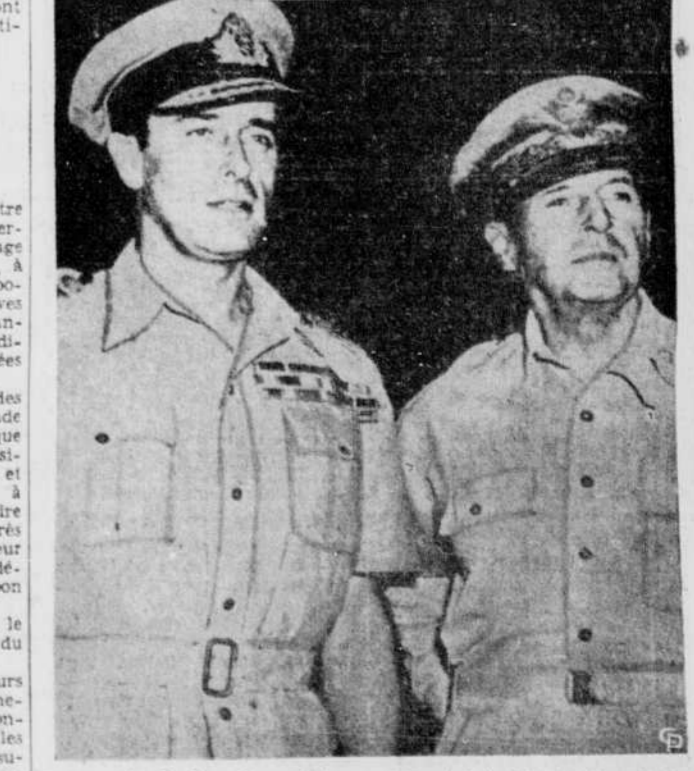
Deux chefs impitoyables. — L'amiral lord Louis Mountbatten, à gauche, et le général de l'armée Douglas MacArthur, qui se sont consultés récemment aux Philippines, possèdent maintenant un commandement plus vaste et ne sont pas d'humeur à donner une seule chance aux Japonais. Pendant que les forces aéro-maritimes de Halsey et de Nimitz donnaient un léger répit au Japon, en attendant sa reddition, les forces de Mountbatten et MacArthur ont continué leurs assauts durant toute la fin de semaine.

Discours du roi le jour V-J LONDRES, 13. (Reuter) — On annonce officiellement que le roi parlera à la radio le soir du jour de la reddition japonaise.