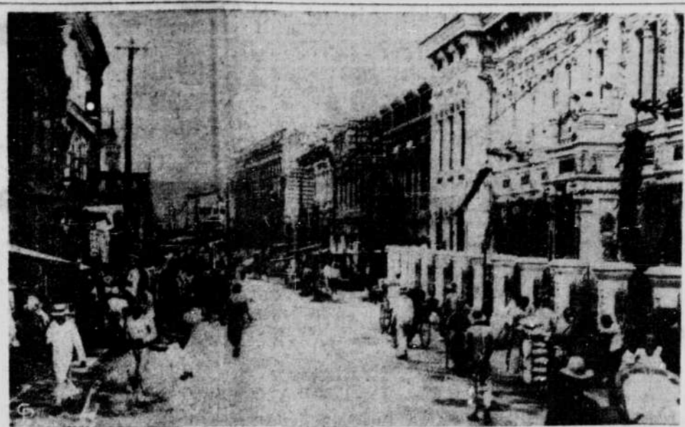
Les Russes menacent Harbin — Voici une photo de la grande ville de Harbin, en Manchouurie, arsenal et grand centre de rails actuellement aux mains du Japon, que les armées russes menacent d'attaquer sous peu, après leur poussée de tanks à travers la plaine manchou, où les Japonais ne peuvent résister plus au poids. On dit que si les Russes envahissent Harbin, ils isoleront probablement un demi-million de Japonais, en Chine. Les Russes attaquent sur un front de 300 milles, aujourd'hui.

Un journal métropolitain a proclamé la "paix" dans des titres énormes et a sorti uniquement de la victoire, alors même que les autorités du gouvernement demandaient de prévenir toute explosion de joie prématurée.