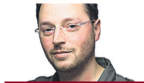
KEVIN MASSÉ JEUX VIDÉO

Douze ans après sa mise en marché, StarCraft jouit toujours d'une réputation et d'une popularité enviables. Vendu à plus de 9,5 millions d'exemplaires, il est devenu un véritable phénomène, notamment en Corée du Sud, où les meilleurs joueurs sont encore idolâtrés. StarCraft II: Wings of Liberty respecte les bases solides du jeu de stratégie en temps réel réalisé lors du premier volet. Le concepteur, Blizzard, en profite toutefois pour polir et mettre au goût du jour son monument vidéoludique.