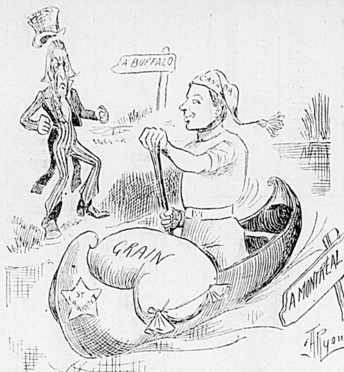
Oncle Sam regardant son commerce de grain prendre la route du St-Laurent.

C'est comme ça que s'exerçait, il y a quelques années, la générosité de quelques entrepreneurs en temps d'élection. Ils faisaient souscrire $50 à celui-ci, $25 à celui-là, puis lorsqu'ils avaient recueilli ainsi $500 ou $1,000, ils venaient verser cette somme