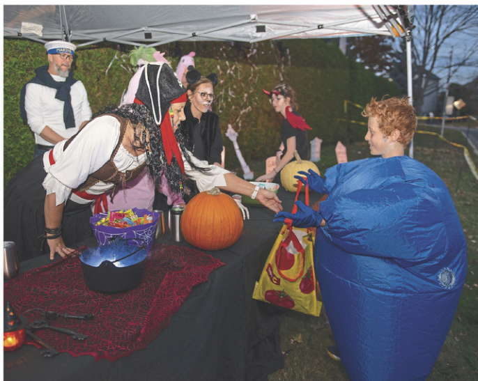
La soirée de l'Halloween s'est déroulée de manière festive et sécuritaire dans la région.