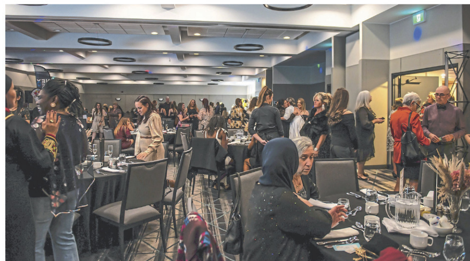
Une deuxième soirée aura lieu en mai 2025 où les organisateurs remettront des prix en argent aux éducatrices en milieu familial.

Le CPE-Bureau coordonnateur Joie de vivre, le CPE - Bureau coordonnateur Le petit monde de Caliméro, la Caisse Desjardins du Haut-Richelieu et NexDev ont organisé une gala de reconnaissance pour valoriser le