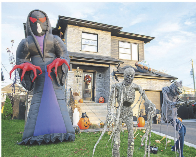
Certains ont aussi installé de jolies décorations dans leur cour.