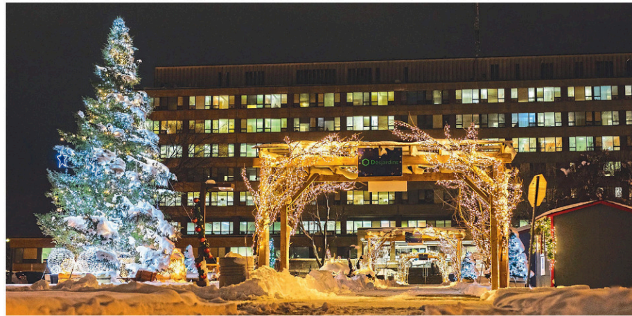
La campagne Lumières d'hiver sera de retour pour une quatrième année.

L'objectif de cette campagne est de faire briller les 15 000 lumières du sapin, créant ainsi une atmosphère féérique et chaleureuse. « Ces lumières réchaufferont le cœur du personnel soignant, des patients et de leurs familles, apportant ainsi une lueur d'espoir et de