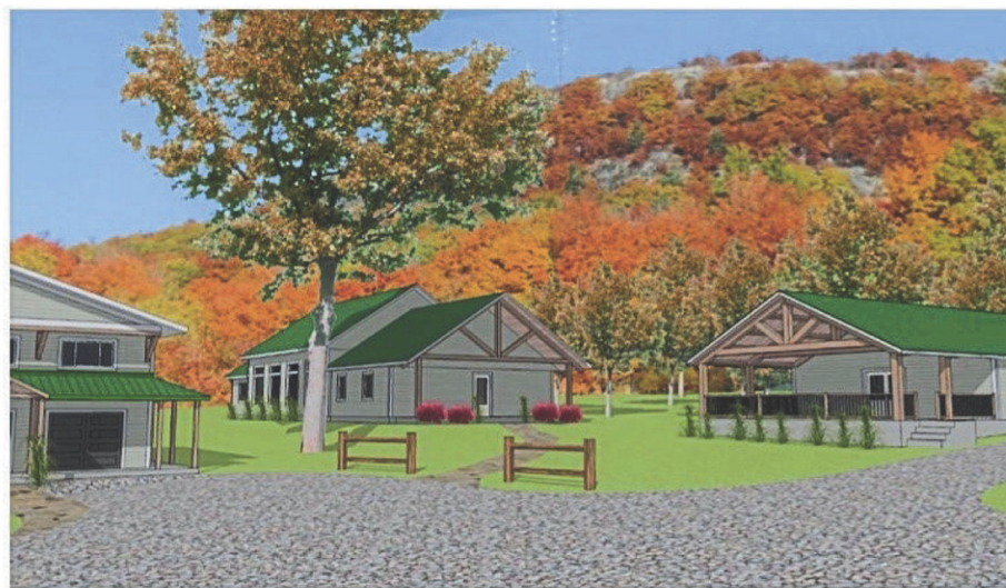
CIME Haut-Richelieu fait partie des lauréats de la dernière édition pour son projet de construction d'un bâtiment multiservice.

Pour déposer une demande, les entreprises d'économie sociale doivent se rendre sur le site