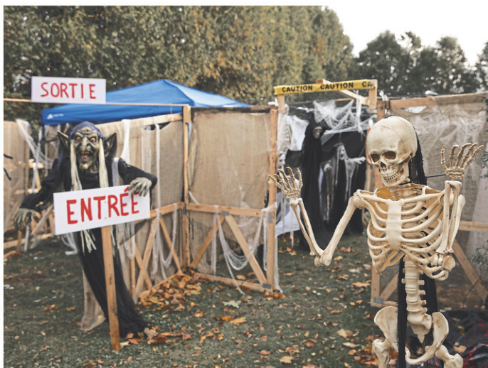
Un résident de la route 133 invitait les visiteurs à prendre part à son parcours rempli de personnages.