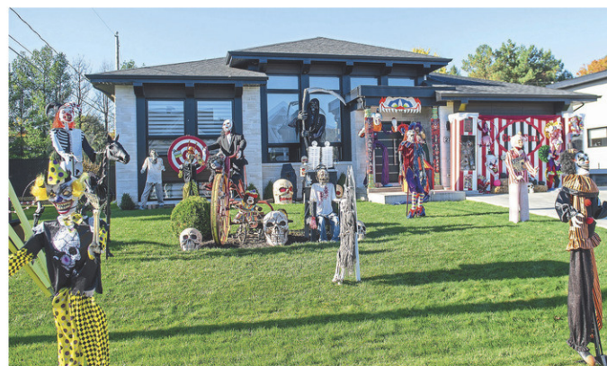
Un cirque maléfique avait pris forme sur la rue Marcel-Arbour à Mont-Saint-Grégoire.