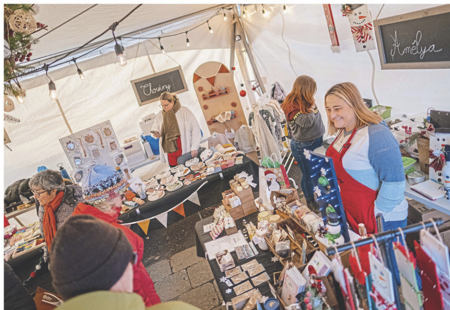
Le Marché de Noël d'antan est de retour à Saint-Jean-sur-Richelieu.

Au programme : animation ambulante, maquillage pour enfants, chansonniers et atelier de danse en ligne. Il sera même possible de découvrir de fascinants oiseaux de proie grâce au retour du Safari de Joanie de la populaire émission de Télé-Québec.