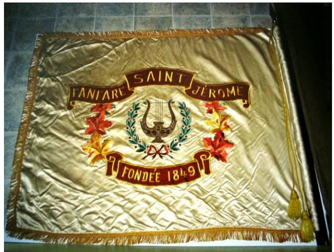
OL6-341 / SHRN Drapeau de la fanfare de Saint-Jérôme