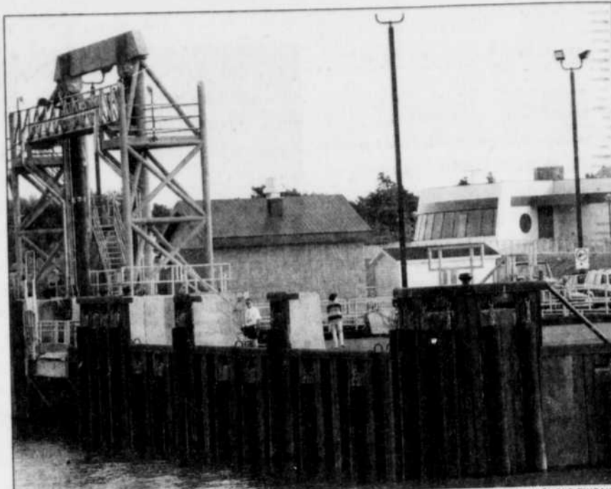
La nouvelle gare fluviale abrite maintenant le bureau d'information de l'Office du tourisme de la Côte-du-Sud.

Reconnue mondialement pour le travail de ses artistes et artisans, la capitale de la sculpture sur bois, Saint-