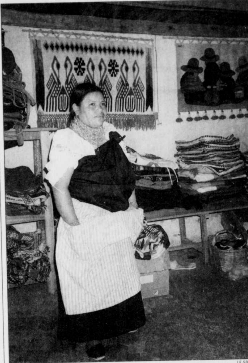
Photographes, n'ayez nul remords de conscience. Les Équatoriens se plaisent à poser. En cas contraire, ils vous le diront d'une façon fort polie.