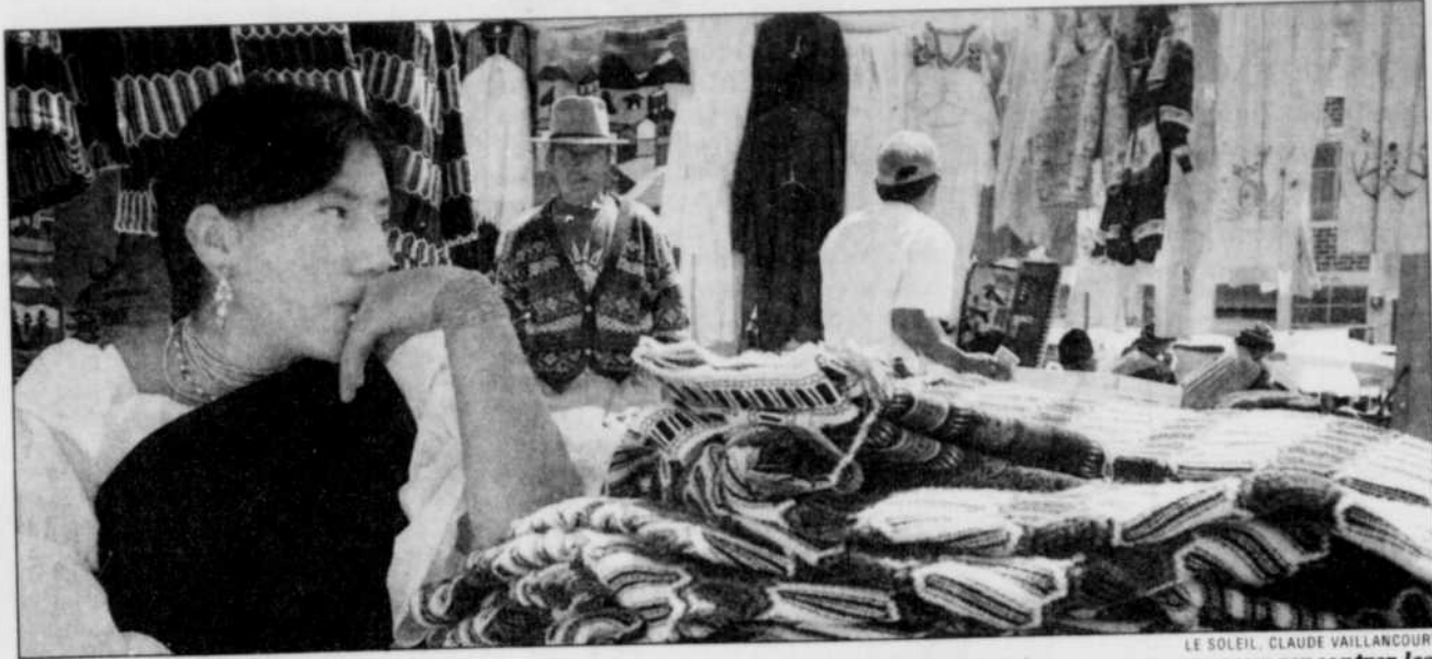
Cuenca se targue d'être la ville culturelle de l'Équateur. C'est aussi un endroit où il fait bon se promener pour rencontrer les marchands locaux.

Pour qui arrive de la capitale, le passage se fait en douceur. Quito bouge, Quito grandit, Quito construit. Quant à Cuenca, elle vit de son passé colonial, de ses musées, de son goût de faire les choses doucement.