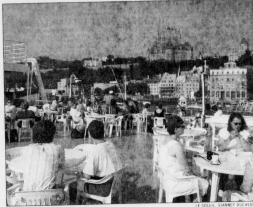
Dès le départ du Vieux-Port de Québec, c'est un spectacle féerique qui s'offre aux croisiéristes.

Croisières Navimex possède quatre bateaux pour ses croisières sur le Saint-Laurent et le Saguenay. Le transporteur utilise son plus gros navire, le Cavalier Maxim, pour le trajet Québec-Montréal. Cet ancien traversier construit en 1962 en Angleterre a depuis été rénové et peut accueillir