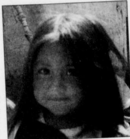
La beauté d'un peuple et la fierté des Équatoriens, tout se lit dans le visage et dans le costume de ces gens.

Durant la période pré-Incas, soit 300 ans plus tôt au même endroit, les indiens Quitus vouaient déjà un culte au dieu Soleil, un dieu qu'ils avaient nommé Inty-Nan (le sentier du soleil). Les jours d'équinoxe, de grandioses cérémonies avaient lieu dans un temple de forme arrondie où, là encore, on ne décelait nulle trace d'ombre sur le coup de midi.