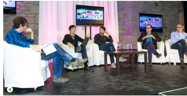
Rencontres de l'ADISQ 2013.