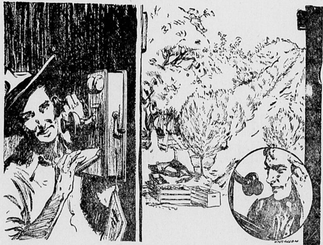
LES CANADIENS ET LEURS INDUSTRIES — ET LEUR BANQUE

Pendant les quatre premiers mois de 1936 le Bureau national canadien de l'enregistrement du bétail a délivré 28,912 certificats de généalogie, approuvés par le ministre fédéral de l'Agriculture.