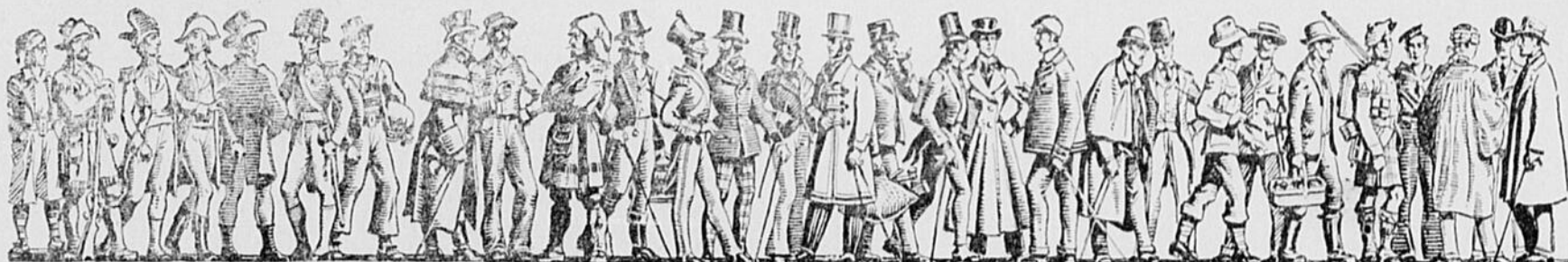
CENT CINQUANTE ANS DANS LA RUE NOTRE-DAME

LES caves construites par John Molson en 1786 font encore partie de la Brasserie Molson. Y descendre aujourd'hui, c'est un peu comme faire un retour sur le passé, se reporter à la fin du dix-huitième siècle. Ces caves, qui nous offrent un bel exemple de la solidité de la construction à cette époque déjà lointaine, font l'objet des commentaires suivants dans deux lettres du fondateur de la brasserie écrites en 1787 et 1788: