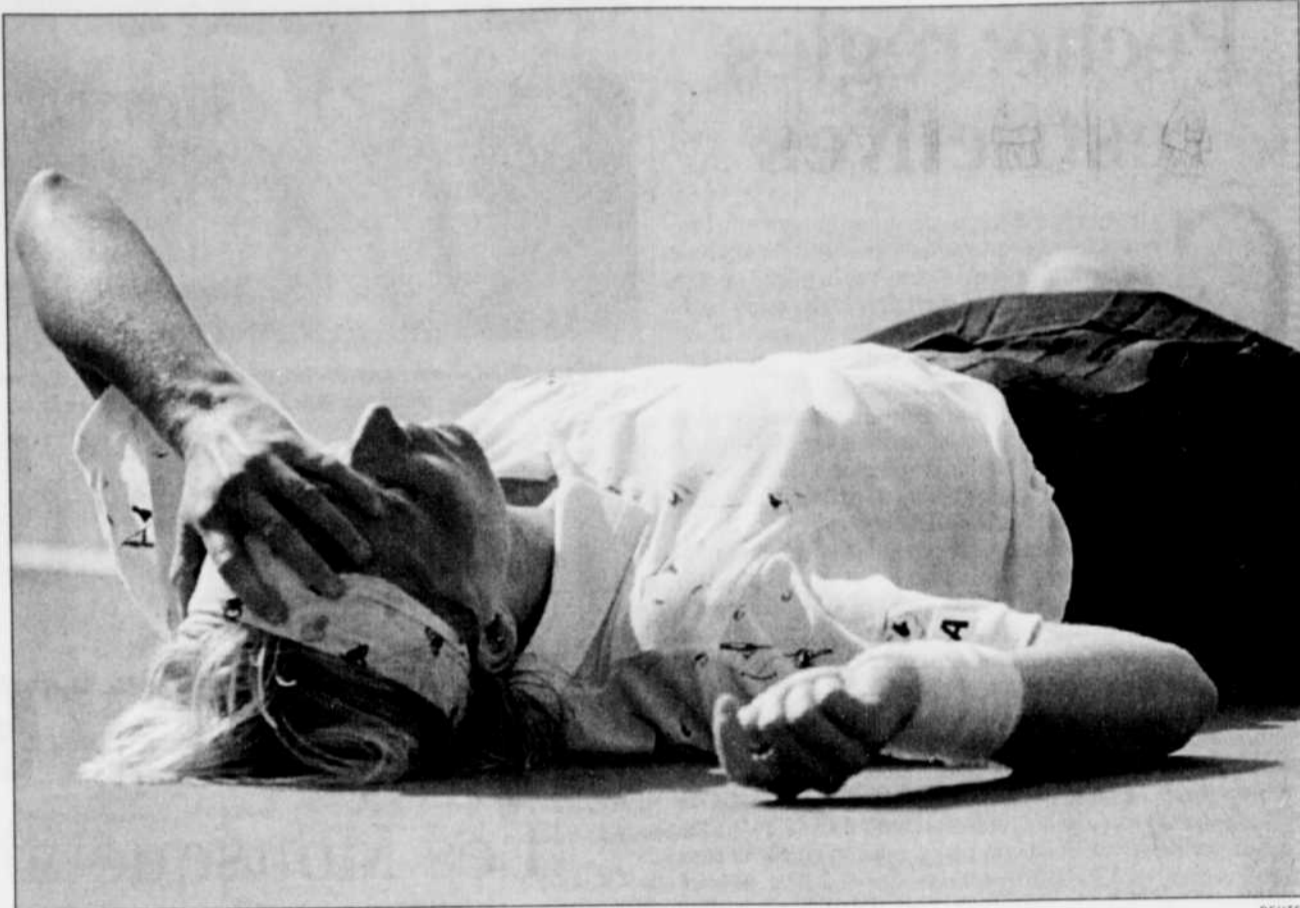
Par un temps caniculaire, Jana Novotna s'est éroulée après avoir vaincu Iva Majoli au cours d'un match qui a duré 2 h 37.

L'équipe de double de Daniel Nestor a battu celle de Grant Connell, hier, pour atteindre les demi-finales des championnats de tennis Lipton. Nestor, âgé de 24 ans, de Toronto, et