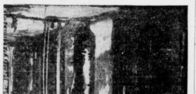
11 morts par le feu à Saskatoon — Cette photo montre les ruines de l'hôtel Barry, à Saskatoon, Sask., après l'incendie qui y fit 11 personnes.

MONTREAL, 12. (P.C.) — Une femme armée d'un revolver est recherchée aujourd'hui par la police de la métropole. Un chauffeur de taxi prétend qu'il fut volé et assassiné par la femme.