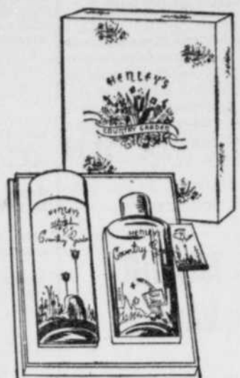
Produits "Country Garden" de Henley, comprenant: parfums, Cologne, Poudre, Rouge, Rouge à lèvres. Prix: de $1.00 à $10.00. Aussi en coffrets.