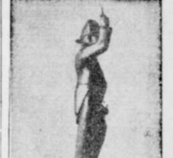
Statue de Churchill — On voit, au haut, un modèle de la statue que l'on projette d'ériger en l'honneur de Winston Churchill, premier ministre de Grande-Bretagne durant la dernière guerre.

Cette photo montre les ruines de l'hôtel Barry, à Saskatoon, Sask., après l'incendie qui y fit 11 personnes.