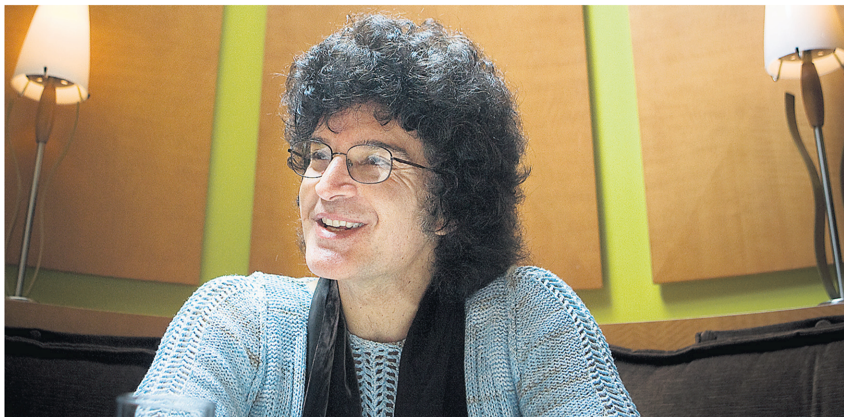
À 56 ans, Gino Vannelli a la crinière plus épaisse et plus noire que jamais, pas une ride ni une livre de trop.

L'homme cherchait, l'artiste aussi. « Au milieu des années 90, j'ai enregistré Yonder Tree , un album qui marquait un virage net avec ce que j'avais fait avant. Ce disque a été assez mal reçu, certains m'accusant même de manquer de respect envers mes fans: ils voulaient entendre le vieux Gino Vannelli... » Après la sortie en 1997 de Slow Love , un autre disque de jazz acoustique, il travaillera entre autres avec le bassiste Alain Caron (Uzeb).