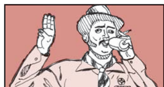
Votre loyal attaché d'exception, Lézard frak.

« Moé, la guitare sèche, je trouve que ça brûle super vite, c'est pour ça que je joue du clavier, ça fait une boucane d'enfer pis ça pue quand ça brûle! Scout? Toujours prêt! »