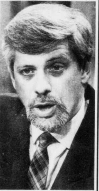
Pierre Marc Johnson

Par ailleurs, le chef péquiste souhaite que le gouvernement libéral soumette le texte de l'entente le plus rapidement possible à une commission parlementaire puis, qu'il la fasse ratifier par le Parlement québécois.