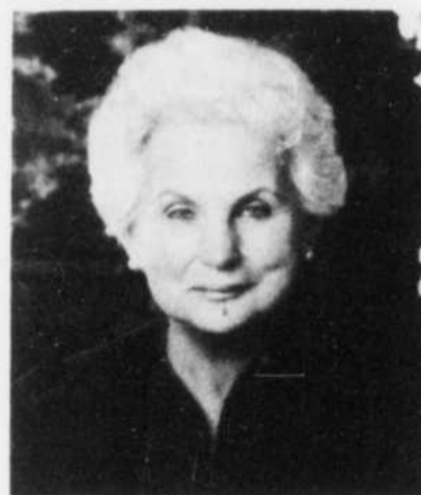
Son excellence le gouverneur général du Canada, Mme Jeanne Sauvé

Le Gouverneur général du Canada Jeanne Sauvé