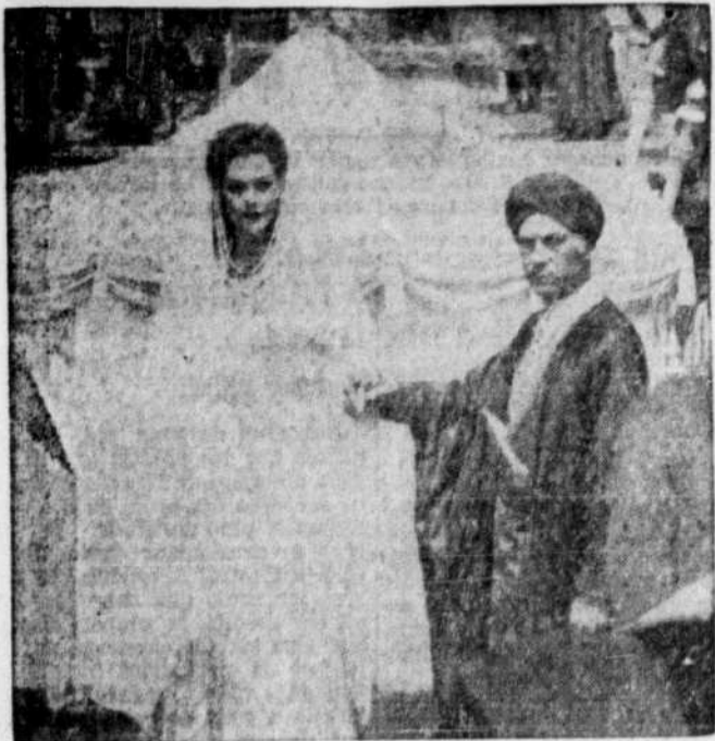
Voici une photo tirée du film "Ali Baba et les quarante voleurs", que le Champlain présente cette semaine en version française.