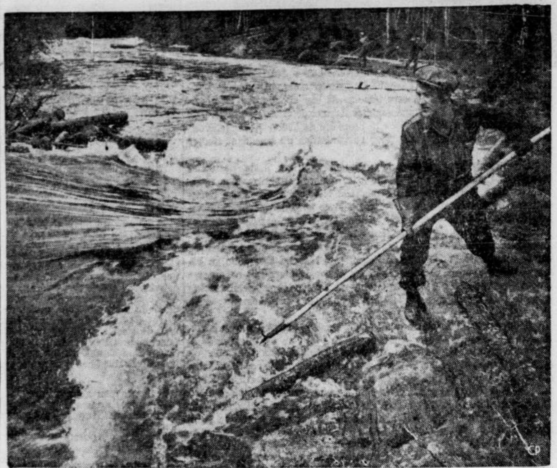
Le flottage de billes sur nos nombreux cours d'eau est l'une des plus caractéristiques de la vie canadienne au printemps. Il indique l'importance de notre industrie des pâtes et du papier qui bénéficie grandement de ce moyen de transport peu coûteux. Cette photo montre les flotteurs à l'oeuvre dans le district de la Gatineau.

Dites à vos paroissiens de ne pas se laisser séduire ni écarter du bon chemin; de ne pas prêter foi aux accusations fausses de l'ennemi; de ne pas lire ses publications sans motif grave et sans l'autorisation nécessaire, et, en tout cas, sans la permission requise pour répondre à ses attaques. Alin-