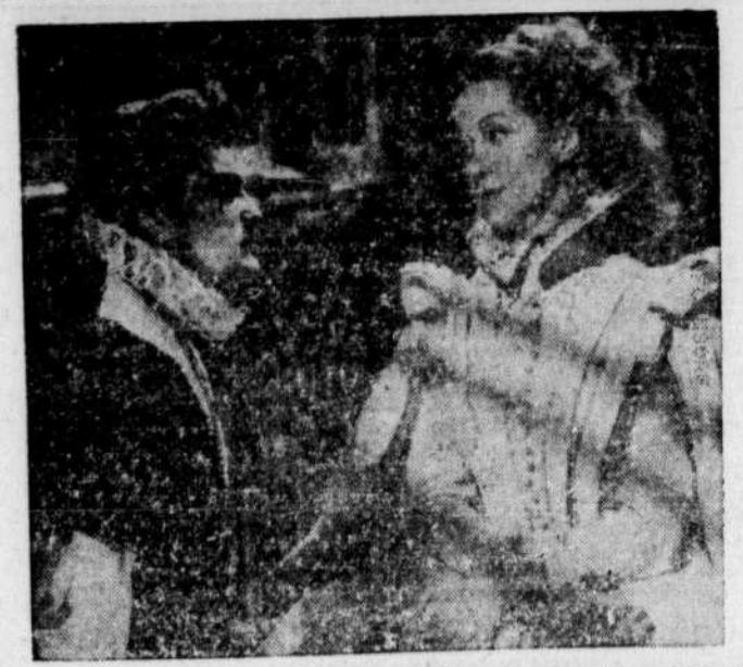
Une belle scène de "Ruy Blas", d'après Victor Hugo, mettant en vedette Danielle Darrieux et Jean Marais, et que le Cinéma de Paris vient de mettre à l'affiche.

Au bénéfice de la crèche Saint-François d'Assise, une soirée artistique et musicale sera donnée par La Comédie Canadienne Eng. avec les concours des enfants de la crèche, mardi soir, 10 mai, à 8 h. 15, en la salle du sous-sol de l'église Saint-Clement, rue Adam angle Saint-Clement. Les billets sont en vente à la crèche, 5136 est, rue Notre-Dame, Tél. CL. 3258 ou à la porte de la salle le soir même. Bienvenue à tous.