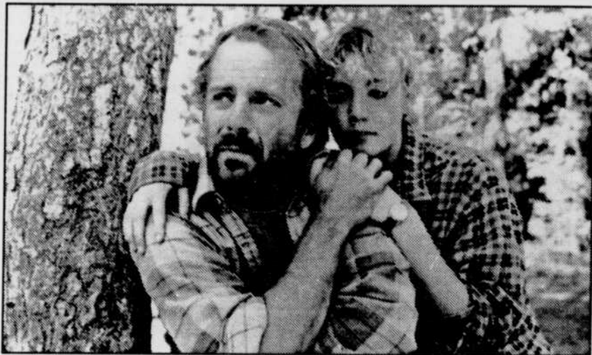
Bruce Willis et Emily Lloyd dans un drame psychologique, « Un héros comme tant d'autres », à l'affiche du SUPER CINEMA de TQS, dimanche à 21h.

Comédie dramatique. - Siegfried rend visite à deux terriers trop choyés.