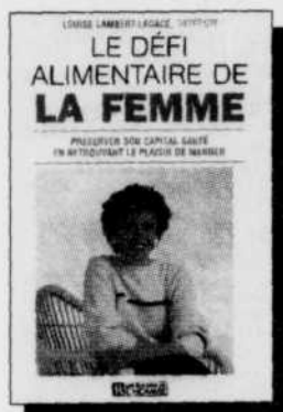
Le défi alimentaire de la femme 18,95 $