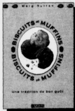
Biscuits et muffins Marg Ruttan 14,95 $

DES MENUS SANTÉ POUR EN AVOIR PLUS POUR VOTRE ARGENT!