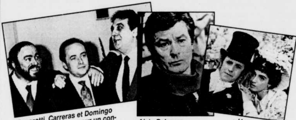
Pavarotti, Carreras et Domingo de nouveau réunis pour un concert au Dodgers Stadium de Los Angeles, samedi, 23h; en reprise dimanche à 20h, à PBS.