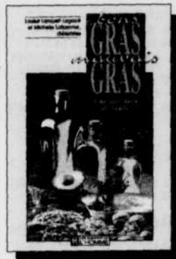
Bons gras, mauvais gras Louise Lambert-Lagacé Michelle Laflamme 14,95 $

POUR RELEVER «LE DÉFI DU GRAS» SANS BRIMER VOTRE PLAISIR DE MANGER!