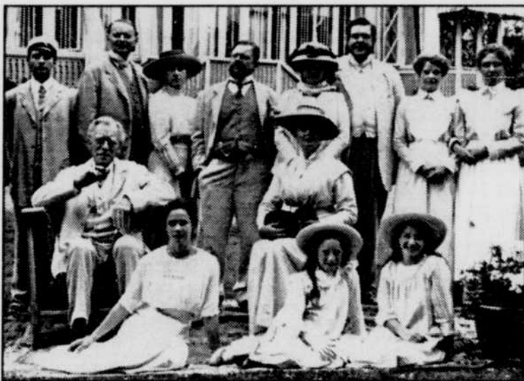
Ingmar Bergman livre un portrait fascinant de ses parents et de leur relation complexe et passionnée dans « Les meilleures intentions », film présenté en primeur aux BEAUX DIMANCHES de Radio-Canada, à 19h.