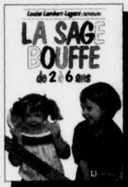
La sage bouffe de 2 à 6 ans 19,95 $