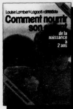
Comment nourrir son enfant de la naissance à 2 ans 17,95 $