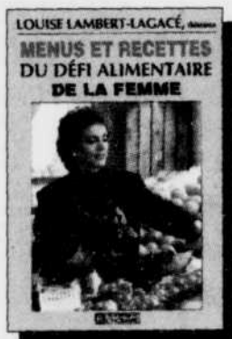
Menus et recettes du défi alimentaire de la femme 15,95 $