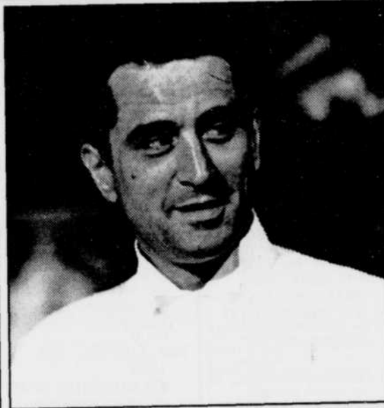
« Il était une fois l'Amérique », drame de moeurs de Sergio Leone mettant en vedette Robert De Niro, présenté à TÉLÉ-SELECTION de Radio-Canada, samedi à 23h20.

FAIRE. Émission pour et par les 16-20 ans qui abordent divers thèmes les concernant directement; participation d'une personnalité invitée et