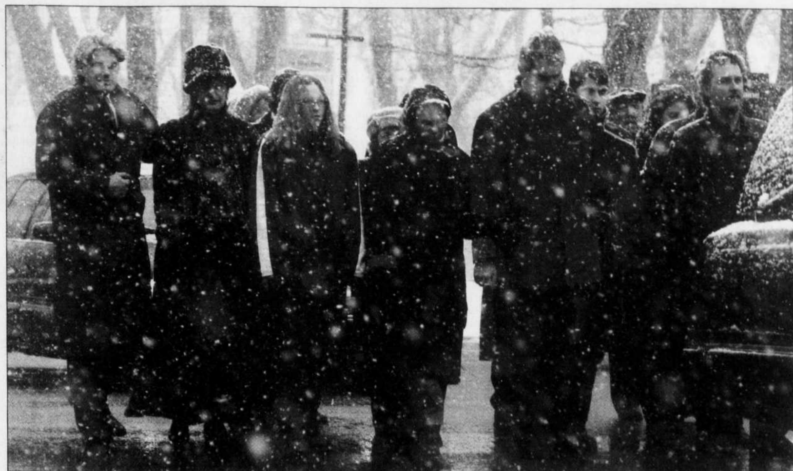
Une neige lourde et abondante tombait sur les amis de Jean-Paul Riopelle qui marchaient lentement derrière le corbillard.