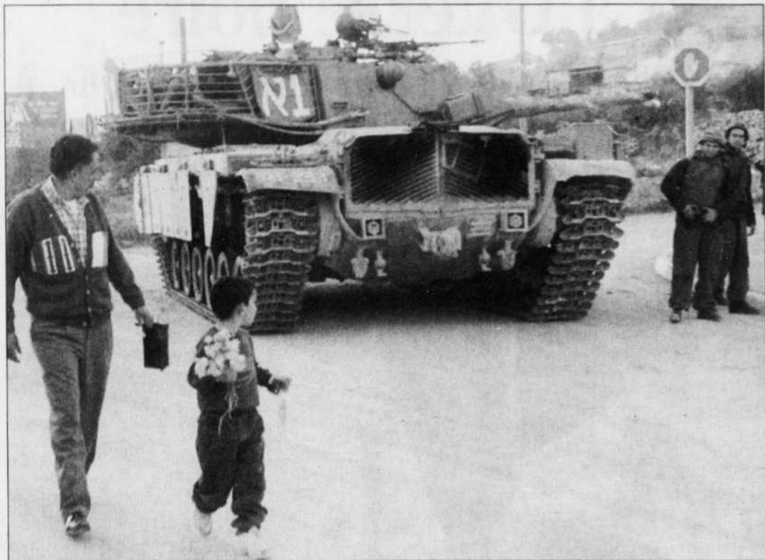
Les chars israéliens avaient commencé à se retirer de la ville de Bethléem, hier.

Le Devoir est publié du lundi au samedi par Le Devoir Inc. dont le siège social est situé au 2050, rue De Bleury, 9 e étage, Montréal, (Québec), H3A 3M9. Il est imprimé par Imprimerie Québecor St-Jean, 800, boulevard Industriel, Saint-Jean sur le Richelieu, division de Imprimeries Québecor Inc., 612, rue Saint-Jacques Ouest, Montréal. L'Agence Presse Canadienne est autorisée à employer et à diffuser les informations publiées dans Le Devoir. Le Devoir est distribué par Messageries Dynamiques, division du Groupe Québecor Inc., 900, boulevard Saint-Martin Ouest, Laval. Envoi de publication — Enregistrement n° 0858. Dépôt légal: Bibliothèque nationale du Québec.