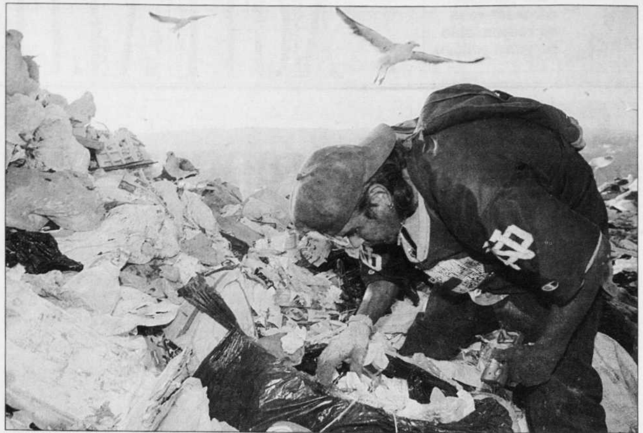
Au Mexique, comme ailleurs dans le monde, nombre de personnes doivent fouiller dans les déchets pour

Dalton Camp avait frôlé la mort en 1993 en raison d'une maladie cardiaque. Une transplantation de cœur controversée lui avait sauvé la vie et lui a donné presque une décennie de plus pour haranguer les politiciens de droite et critiquer l'état de la démocratie au Canada.