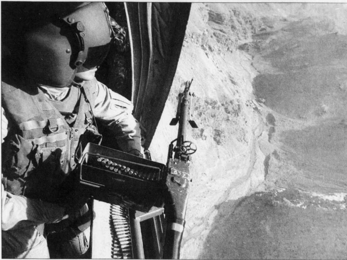
Un soldat américain survole l'est de l'Afghanistan à bord d'un hélicoptère Chinook. Les Américains, encore sous le choc de septembre, continuent d'approuver aujourd'hui à 90 % l'engagement de leurs troupes en Afghanistan.

Elle sera longue. Le président Bush l'a dit et martelé! Et l'Amérique, encore sous le choc de septembre, continue d'approuver aujourd'hui à 90 % l'engagement de ses soldats en Afghanistan. Le traumatisme de septembre a touché l'Amérique dans ses entrailles et ses viscères, dans tous les sens du terme. La peur ne disparaîtra pas. Ceux qui comptent sur un retournement rapide de la politique américaine se trompent. Ceux qui ont encore foi en la démocratie se leurrent aussi. Seul le secrétaire Powell réussit à maintenir une po-