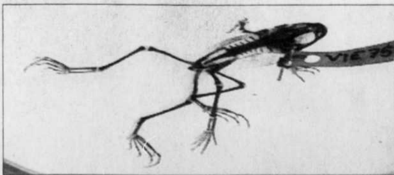
Une grenouille à six pattes, exemple des mutations qui se produisent dans les cours d'eau agricoles à cause des pesticides.

Certes, La Loi de l'eau , qui aurait pu tout aussi bien s'intituler La Loi du si-