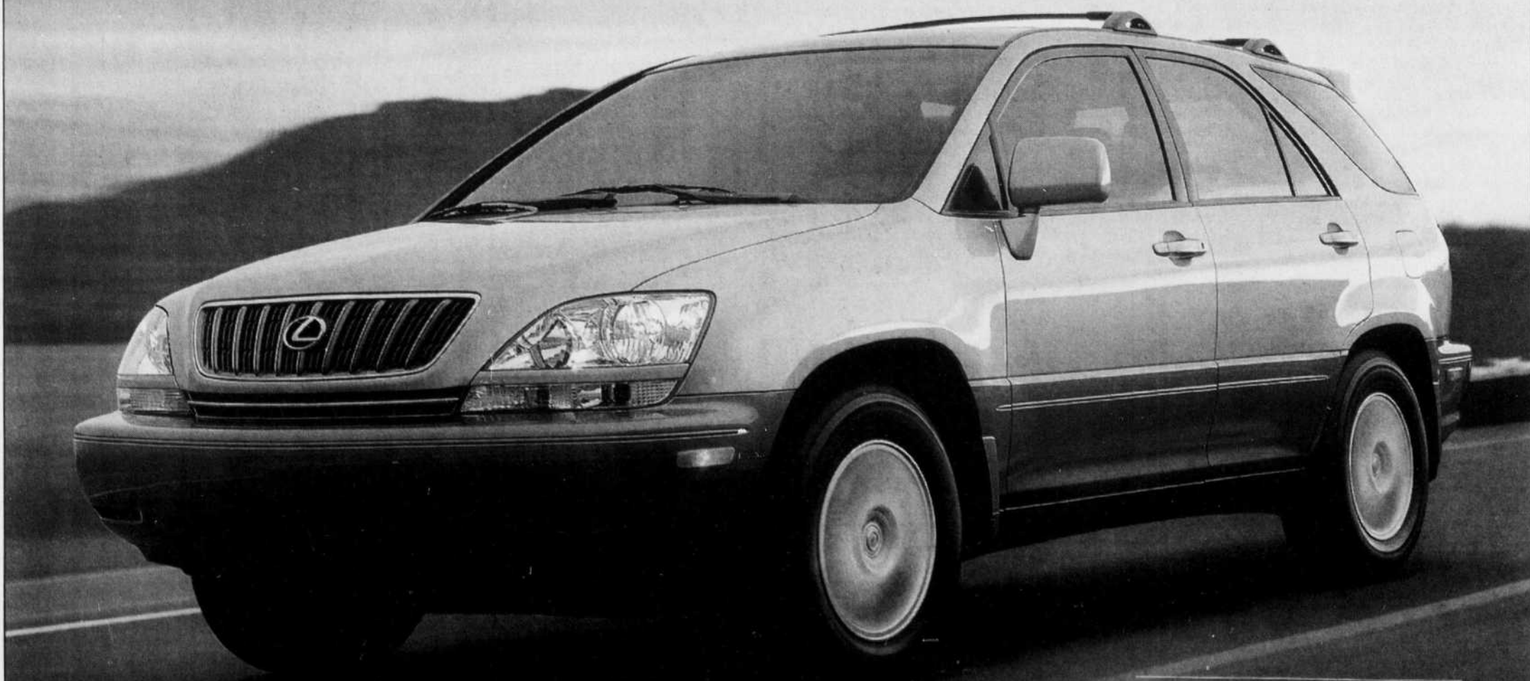
LE LEXUS RX 300 2002