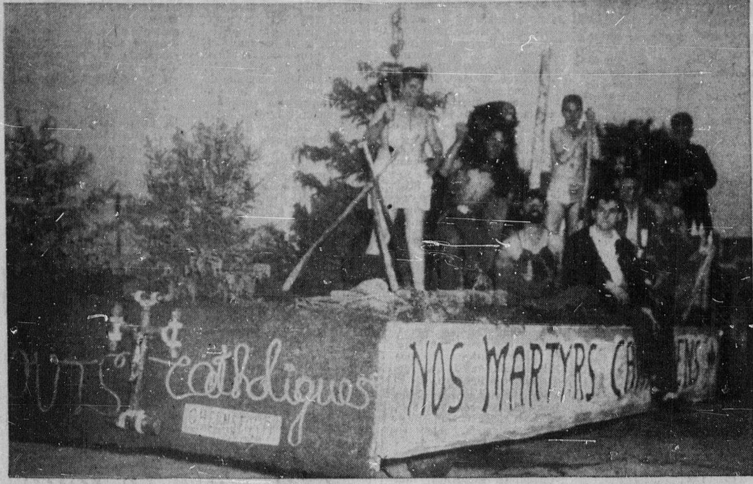
LE CHAR GAGNANT — Les scouts catholiques canadiens-français de Chelmsford qui avaient choisi comme thème de leur char allégorique "Nos Martyrs canadiens" ont remporté le premier prix du grand défilé patriotique. La fête de mercredi a attiré dans le beau village d'Azilda plus de 3,000 personnes.

47e année — No 148 OTTAWA, VENDREDI, 26 JUIN 1959 Le numéro: 10 cents