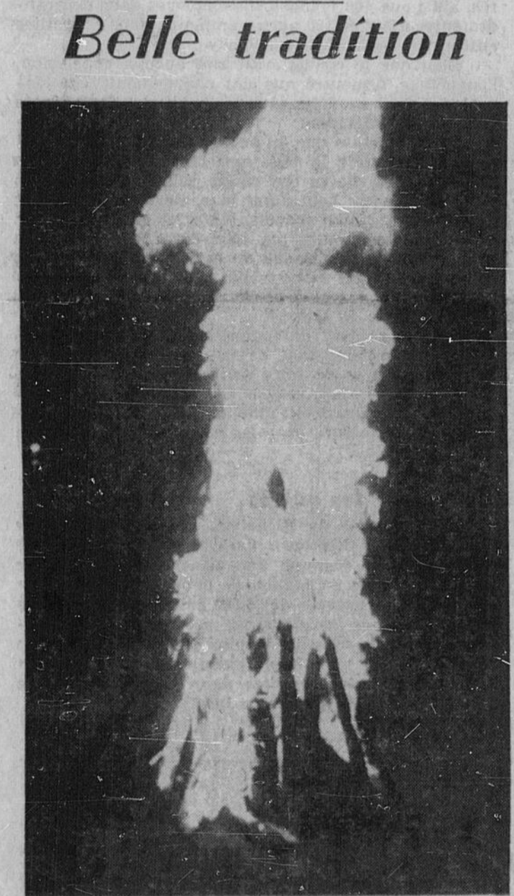
FEU PATRIOTIQUE — Pour terminer en beauté le grand défilé de la Saint-Jean, à Azilda, la foule a admiré le feu de la St-Jean, qui fut préparé par les scouts d'Azilda sous la direction du scoutmestre Jean-Paul Beausoleil.