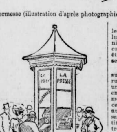
Le kiosque des journaux à la kermesse

On lit dans les journaux de Constantinople : "Sa Majesté, le sultan, toujours désireux d'adopter les réformes compatibles avec les circonstances..."