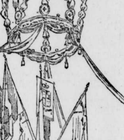
Le pavillon des fleurs à la kermesse (illustration d'après photographie Laprés et Laverigne)