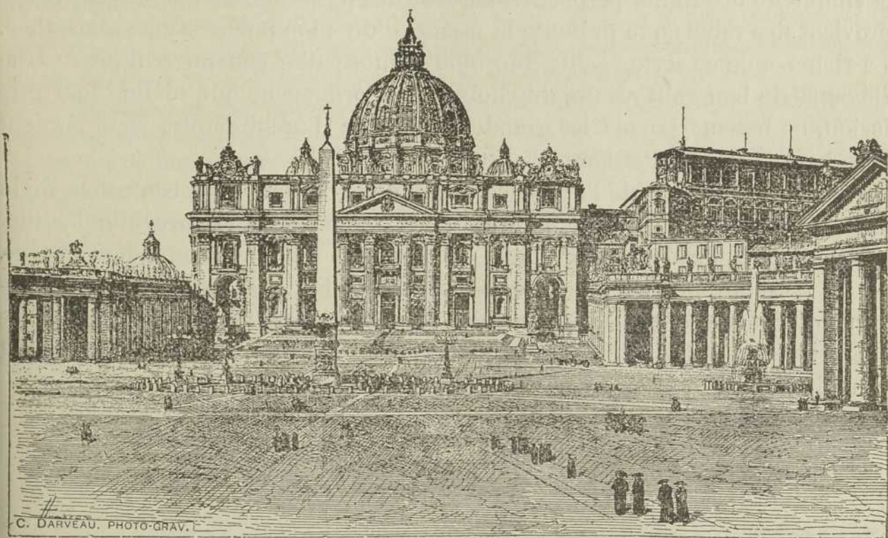
ÉGLISE SAINT-PIERRE DE ROME

Passant à la sculpture, nous retrouvons encore l'immortel Michel-Ange, l'auteur inimitable du Moïse , du Vatican ; Donatello, qui a laissé une tête de sainte Cécile considérée comme un des plus purs chefs-d'œuvre de la sculpture florentine ; Verocchio, non moins célèbre que son compatriote Donatello, et une foule d'autres qu'il serait trop long d'énumérer.