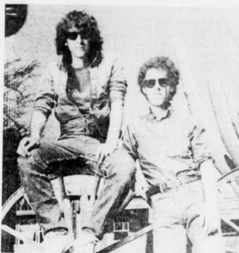
Joel et Ethan Coen, les deux frerots qui ont produit le film.

Ethan Coen, ces deux frerots qui ont produit cette comédie aux accents surréalistes, nappée d'une sauce western. Ces deux jeunes hommes, dans la trentaine, qui font déjà beaucoup jaser à Cannes, avaient produit en 1984 un thriller peu ordinaire, Blood Simple (Sang pour sang) , qu'il vaudrait la peine un jour de programmer lorsque ces deux frères réaliseront leur prochaine oeuvre qui risque de marquer le cinéma américain comme par exemple David Lynch est en train de le faire.