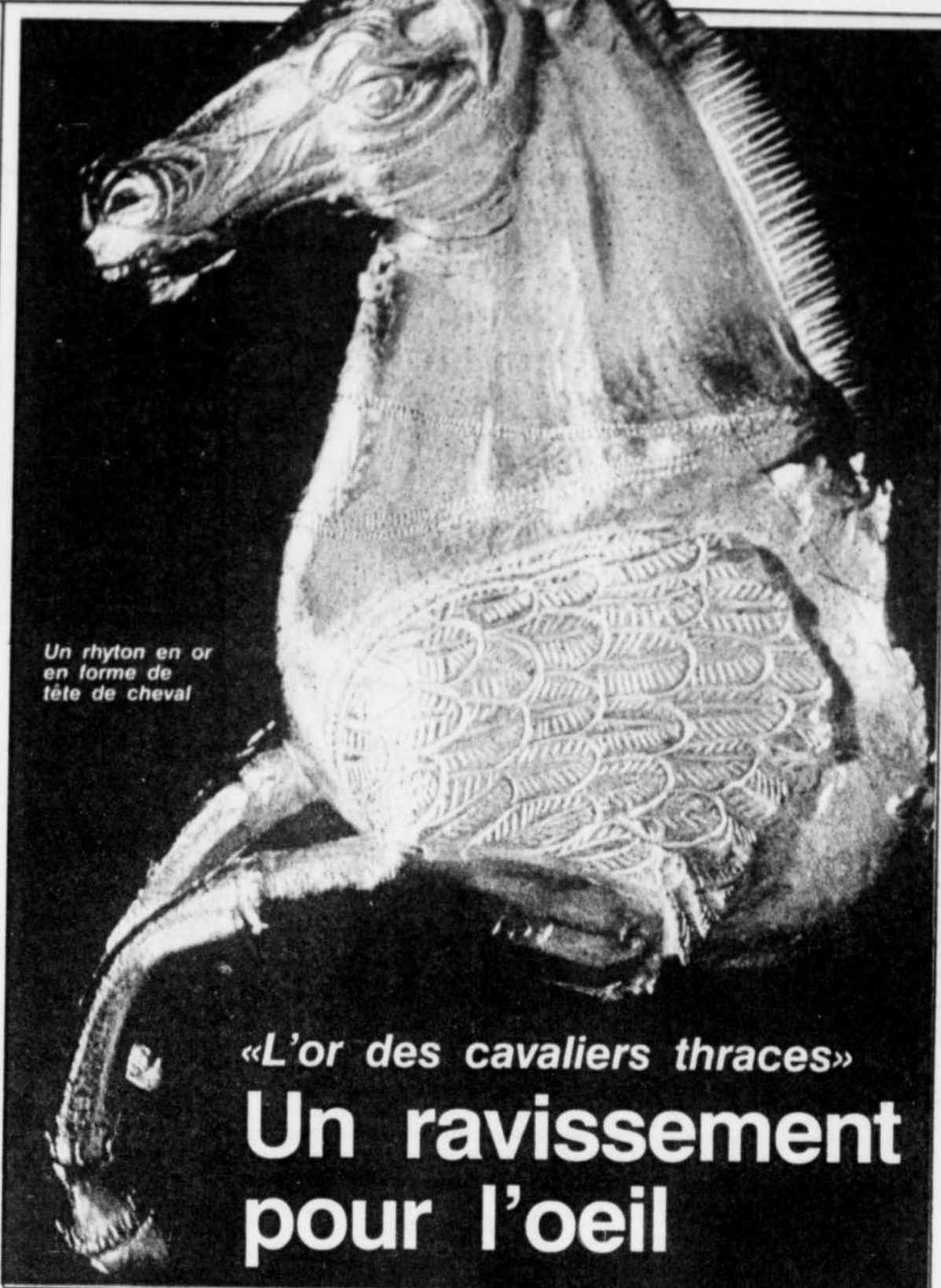
Un rhyton en or en forme de tête de cheval