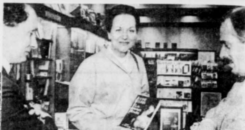
La Table ronde/Lacombe

Les amours blessées, Jeanne Bourin, La Table ronde/Lacombe, 310 pages.