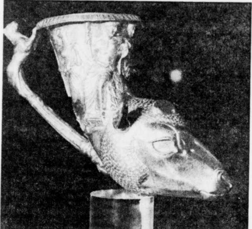
Rhyton en forme de tête de bélier, de la fin du 4e siècle avant Jésus-Christ

L'exposition, présentée au Palais de la civilisation (le même endroit que pour Ramsès et les splendeurs de Chine), offre l'avantage d'être suffisamment documentée en elle-même pour que le néophyte puisse s'y aventurer sans craindre de s'y perdre.