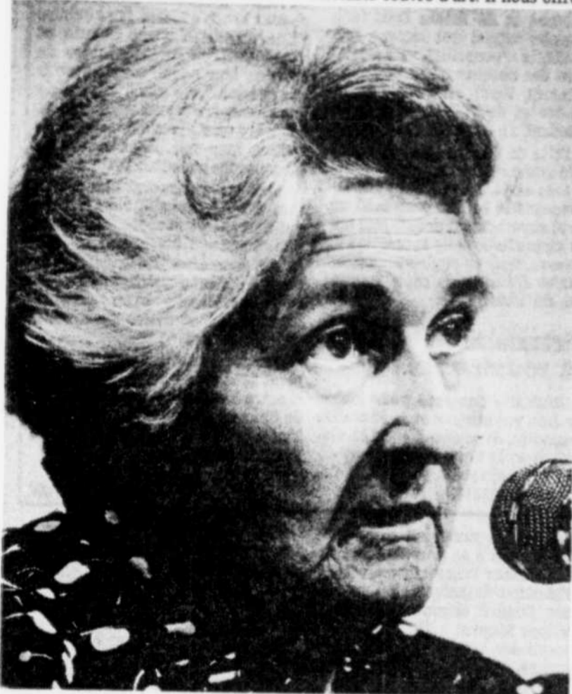
Françoise Dolto lors de la conférence qu'elle donnait cette semaine à Québec