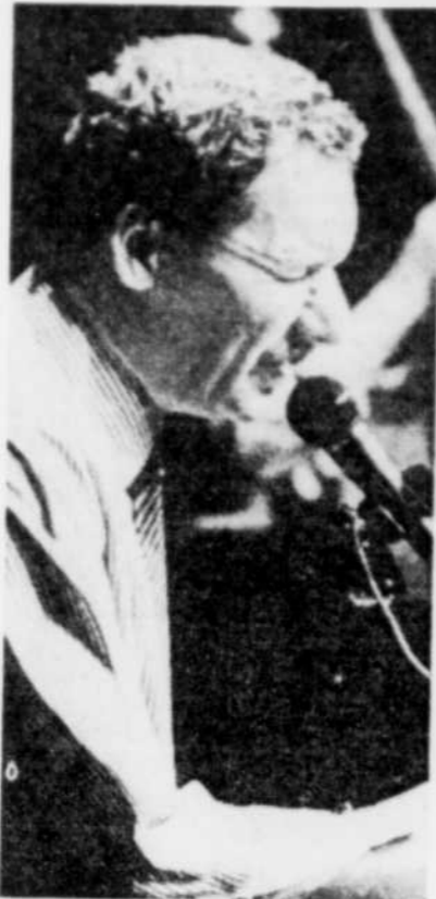
Paolo Conte, un chanteur populaire italien qui n'est encore que peu connu ici, mais triomphe en Europe. Le festival ne sera donc pas que francophone...

La visite de Conte au Québec pour le Festival international de jazz de Montréal, où il ne chantera qu'une fois comme ici, était déjà connue et c'est un secret de polichinelle, dans les milieux bien informés, que la célèbre chanteuse de jazz américaine Helen Merrill profite de son séjour dans la métropole