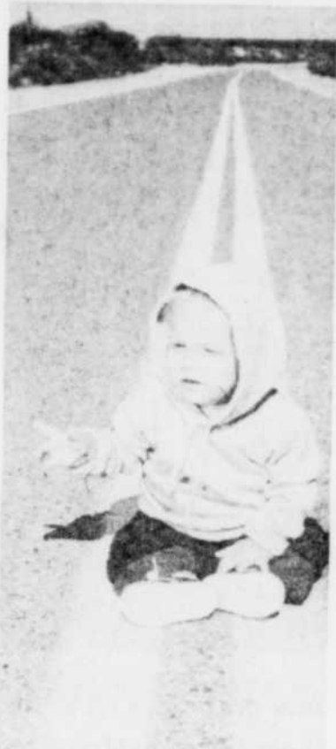
Bébé Arizona en plein milieu de la route.

«Regardez le kodak en face, ne bougez pas. Clic. Ensuite, de côté.