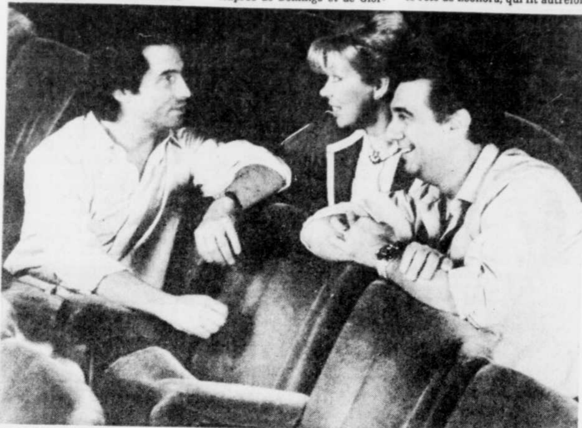
Riccardo Muti avec ses deux principaux interprètes, Mirella Freni et Placido Domingo

◆Riccardo Muti n'est pas de ceux qui craignent le mauvais sort. Pensez donc, pour son premier enregistrement avec les forces réunies de La Scala, théâtre lyrique dont il assume la direction musicale depuis cette année, son choix s'est porté sur La Forza del destino , l'opéra maudit de Verdi.