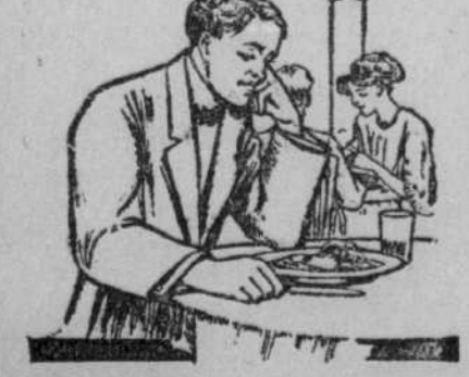
Etes-vous un de ceux à qui chaque repas est toujours une nouvelle source de souffrance?

Le cadavre a été transporté à l'école de médecine où il sera examiné. Les parents de l'enfant phénoménal ont autorisé seulement une autopsie et un rapport sera envoyé à ce sujet à l'académie de médecine de Paris.