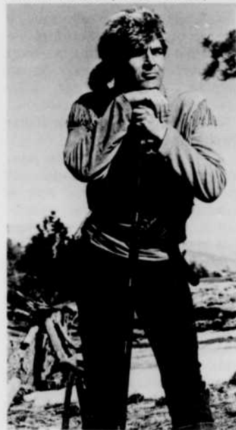
Daniel Boone (Fess Parker)