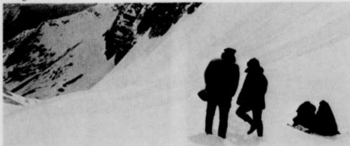
Un grand défi

James Murray et Eric Till ont réalisé Un grand défi . Texte et scénario: William Whitehead et Timothy Findley. Musique: Louis Applebaum.