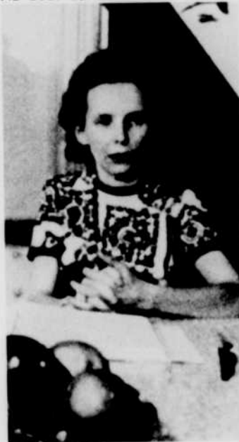
Au bout du chemin