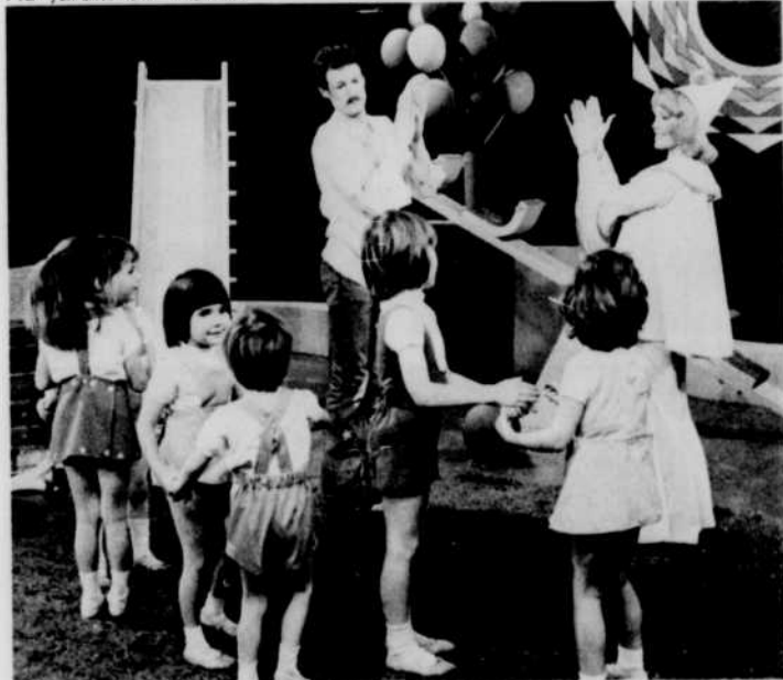
Au jardin de Pierrot