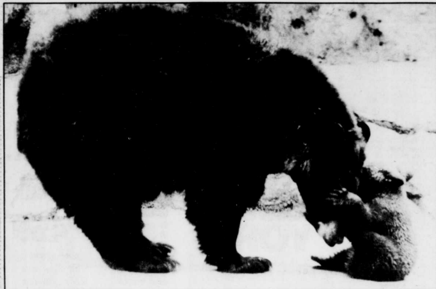
Environ un millier d'ours habitent sur le territoire du parc national Yellowstone, au Wyoming, qui reçoit la visite de deux millions de visiteurs annuellement.

Ces derniers démentent également une histoire horrible qui serait arrivée au début des années 70. On raconte que pour prendre une photo d'un ours embrassant leur fille, des campeurs auraient enduit de miel les joues de l'enfant qui serait morte d'un coup de patte de l'animal. C'est une fable, répètent les rangers.