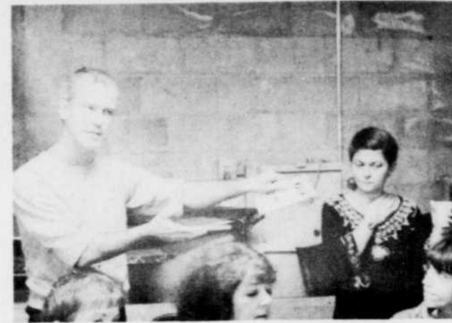
Le théâtre entre chien et loup

19, 24, 25 et 26 septembre LA GUEULE OUVERTE ET FERMÉE