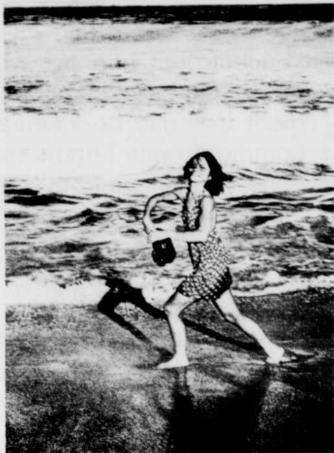
Denis Forcier: La Mère qu'on voit danser, 1979