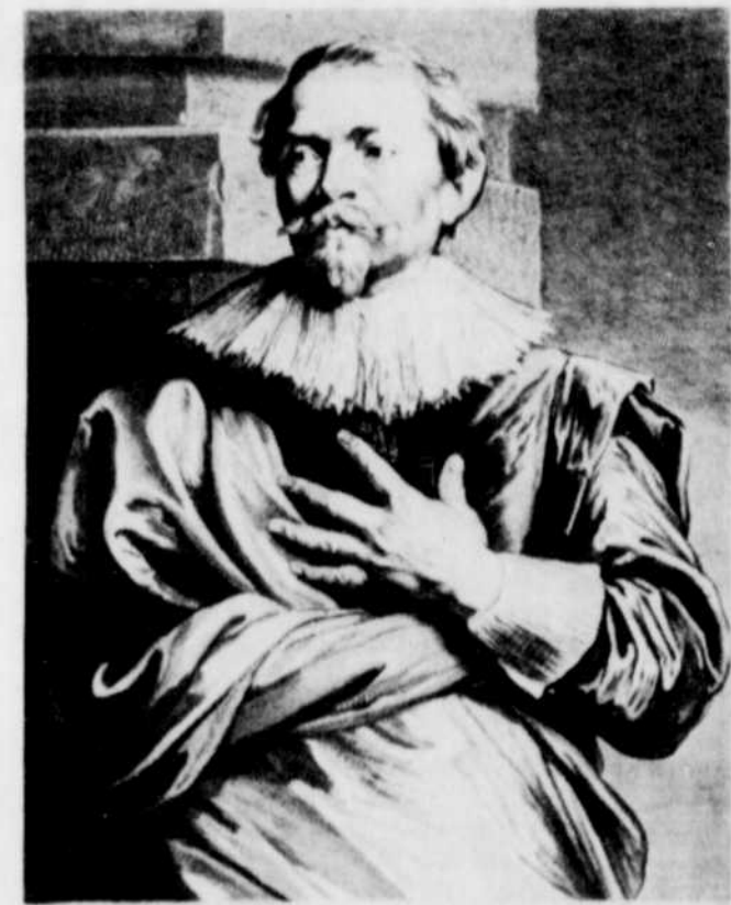
Jacques Jordaens. Gravé par Pierre de Jode le Jeune. 2e état. 24,9 x 17,6 cm.

Les estampes qui forment cette série sont fascinantes du point de vue artistique et du point de vue historique. Ensemble, elles donnent un aperçu inestimable de la pratique de l'art au dix-septième siècle et mettent en lumière l'esprit de l'époque où Van Dyck a travaillé et vécu. Soixante-sept des cent planches originales font partie de la présente exposition qui provient de la collection de la Galerie nationale du Canada. Ce texte est extrait du Journal (no 38, préparé par Alain McNaim) de cette même institution.