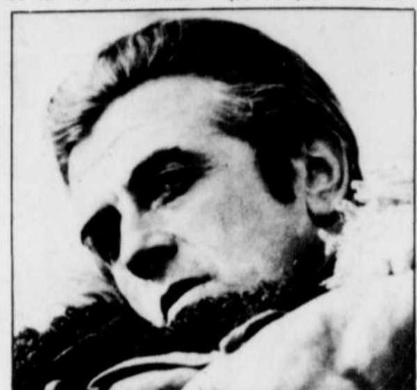
Andrzej Wajda: un réalisateur témoin de sa génération

les exégètes ont souligné le romantisme, l'expressionnisme et le tragique, demeure indissociable de l'histoire de la Pologne. Les rapports entre l'homme et l'histoire constituent la clé de voûte de son oeuvre. Fils d'un officier de carrière, le petit Andrzej a treize ans lorsqu'éclate la guerre de 1939 et sa vie s'en trouve