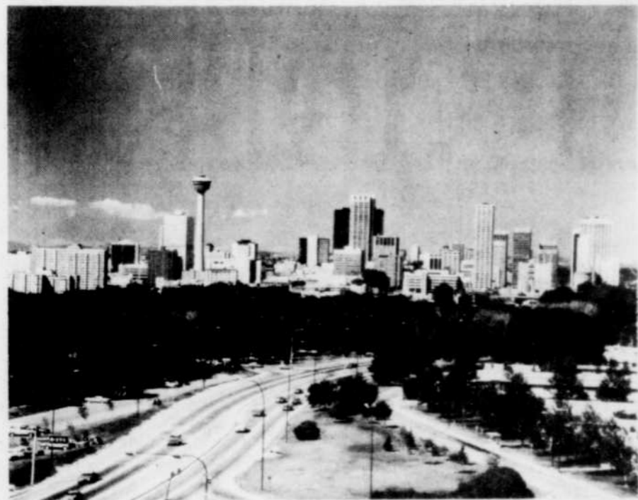
Calgary est une ville vibrante d'énergie et facilement accessible par plusieurs moyens de transport. La ville compte 545 parcs, beaucoup comprenant des terrains de jeux et qui ne connaît pas le Stampede?

La nouvelle législation interdit également toute activité pouvant gêner la méditation, à moins de 200 mètres d'une église. Cette disposition a fait dire à un