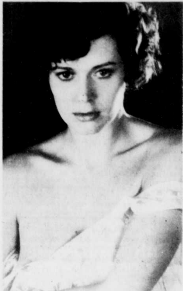
Sylvia Kristel dans le film de Just Jaeckin "L'Amant de Lady Chatterley"