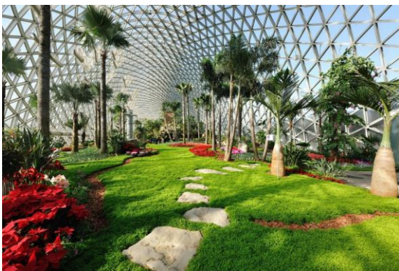
Une serre vue de l'intérieur