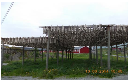
« Ça sent le poisson séché !