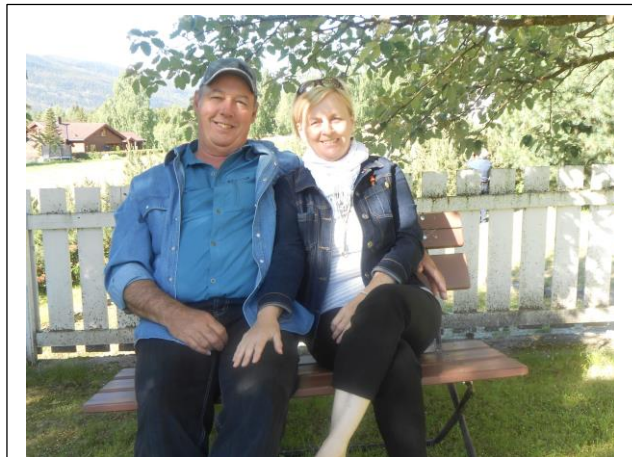
Merveilleuse vie !

Pour terminer ce survol scandinave, je partage avec vous un proverbe norvégien qui saura vous plaire assurément : Plus on vit, plus la vie devient merveilleuse !