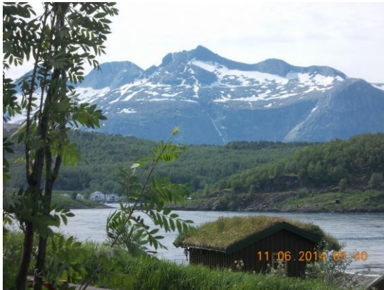
Maison au toit végétal