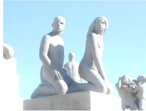
Au Parc Frogner Sculptures de G. Vigeland