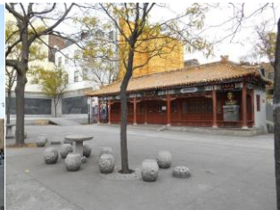
Place Sun Yat-Sen