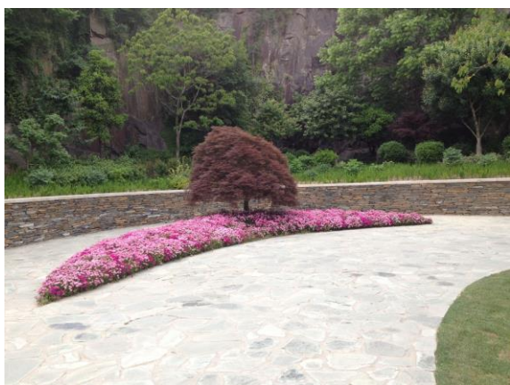
Le « Quarry Garden »