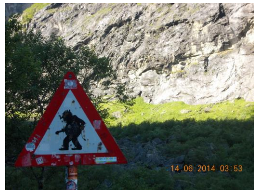
Attention aux Trolls