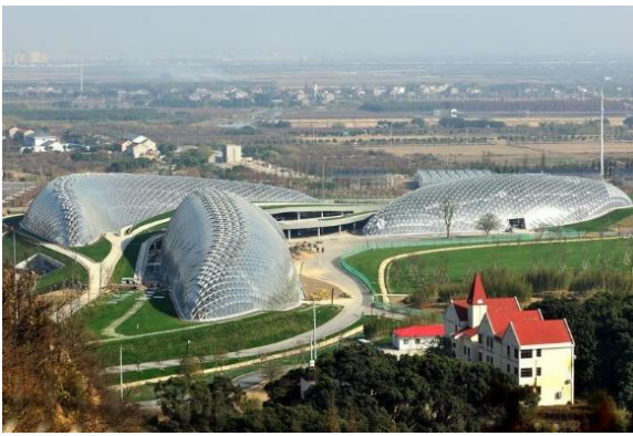
Les trois magnifiques serres