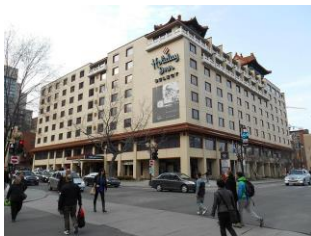
Hôtel Holiday Inn