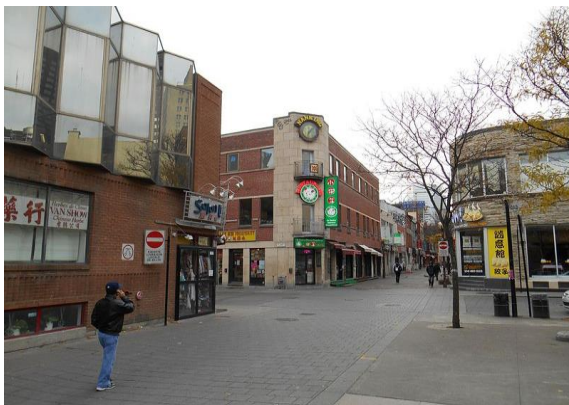
Rue De La Gauchetière

(Voir le site de l'ARJBM pour lire le compte rendu de la visite)