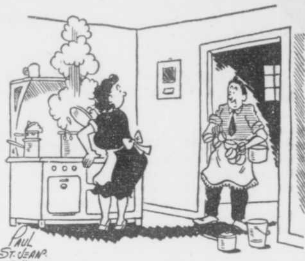
MA FEMME M'ENVOIE POUR EMPRUNTER UN PEU DE TOUTES SORTES DE CHOSE... ELLE VOUDRAIT REALISER UNE RECETTE DE MME. ROSE LACROIX QU'ELLE A ENTENDU A L'ENSEIGNE DES FINS GOURMETS!

J'avoue espérer plus et mieux de "Mlle Josette ma femme" inscrite pour le prochain spectacle du "Théâtre du Rire".