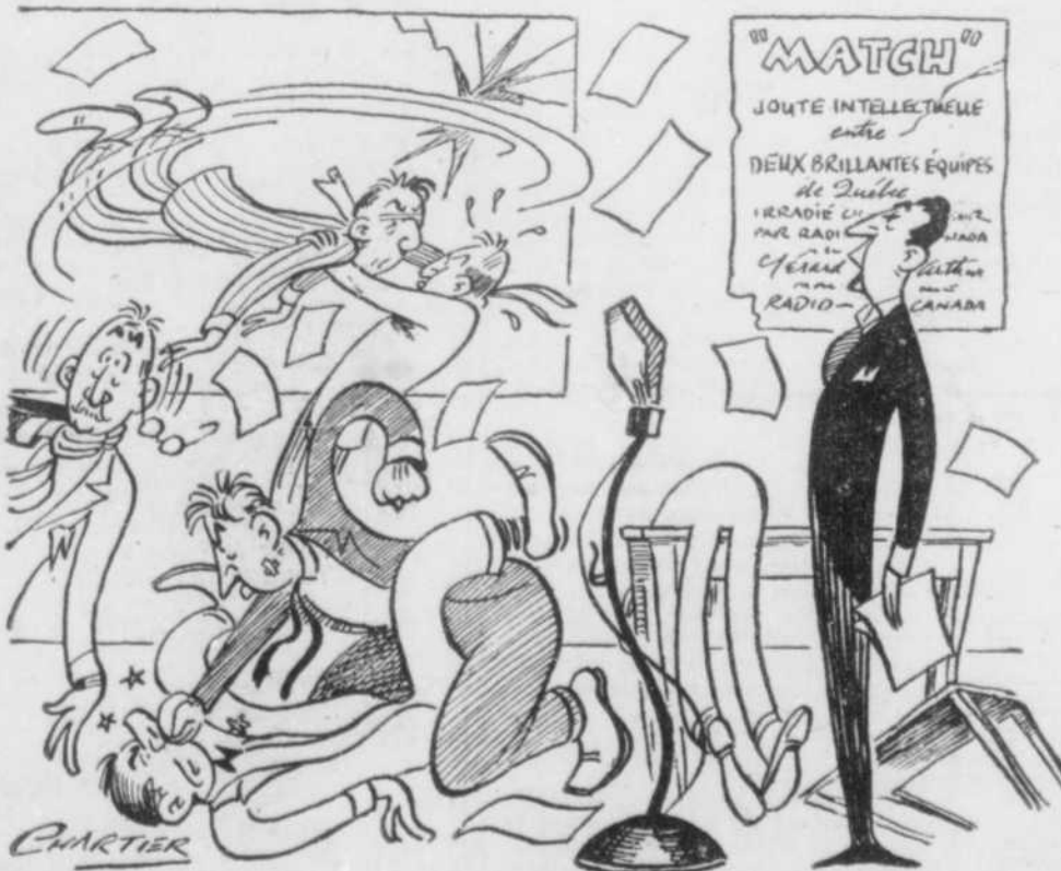
"Voyons, messieurs — un peu moins d'enthousiasme et un peu plus de décorum, s'il vous plaît!"

Le Comité de la Fête patronale des artistes remercie à l'avance le Directeur régional de Radio-Canada et les directeurs des postes de radio privés, les directeurs des troupes de théâtre et les magnats de notre cinéma, pour leur précieuse collaboration.