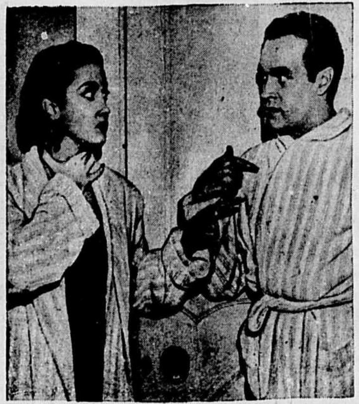
"My Favorite Brunette" et non "13 rue Madeleine" t'él qu'annoncer dans ce journal, prendra l'affiche du théâtre Capitol, vendredi. On voit ici Bob Hope et Dorothy Lamour dans une scène de ce film.