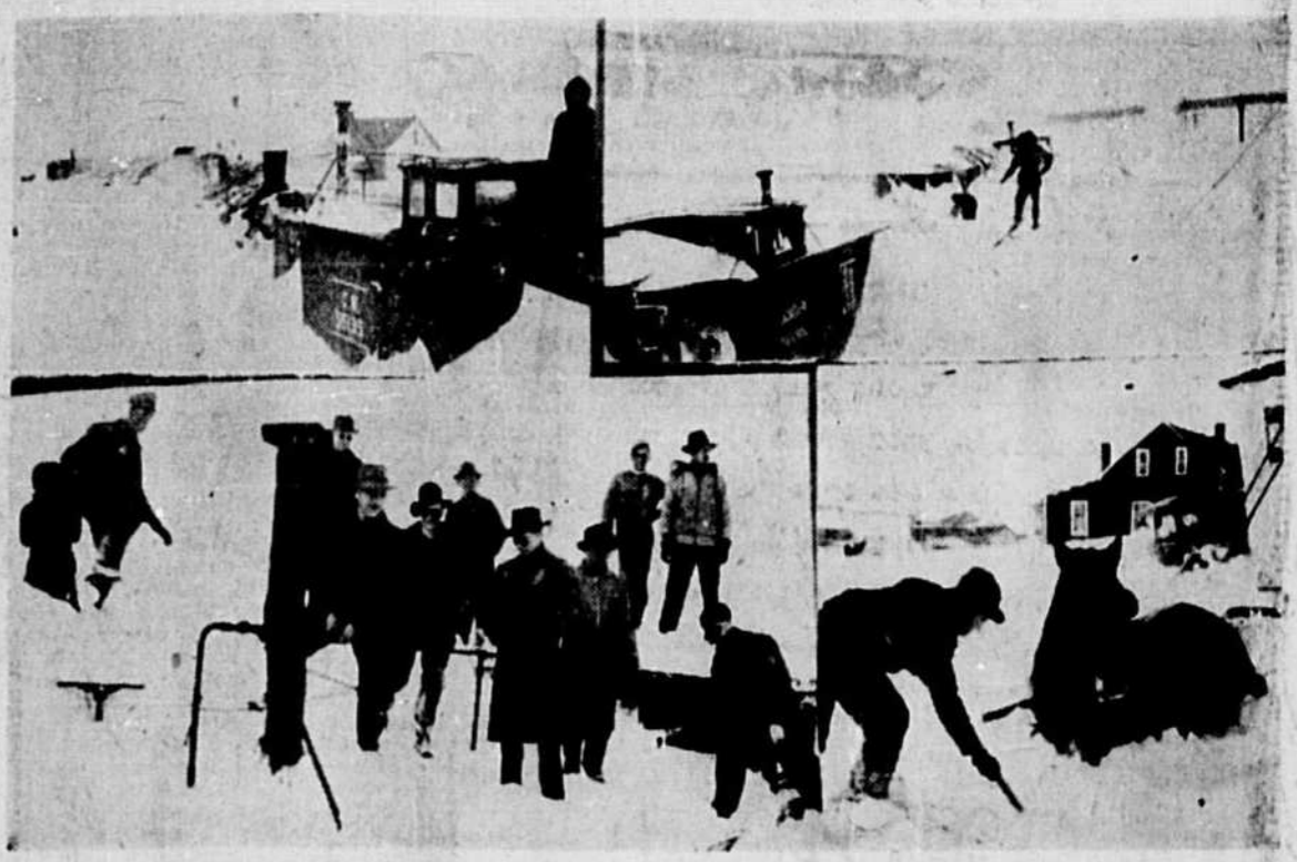
Même pour un Montréalais rompu à l'enneigement, les visions de neige de l'habitée ne laisse pas d'être impressionnantes. C'est ainsi qu'une récente bordée de neige s'est abattue dans la région d'Amos, immobilisant un train. Ci-dessus, où l'animal en a vraiment par-dessus la tête. Ces événements se sont déroulés le 28 mars, il y a quelques jours à peine.