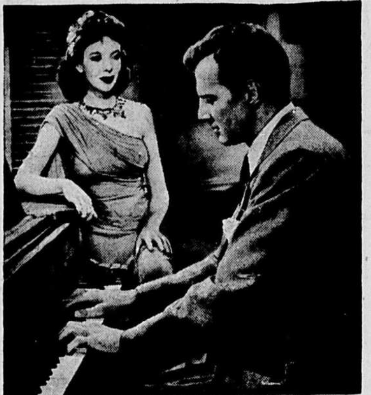
Ida Lupino, la vedette du film "The Man I Love" présentement à l'affiche du théâtre Princess, a beaucoup d'admiration pour Sam Thomas (Bruce Bennett) un pianiste, qui après avoir essayé une peine d'amour, a noyé sa peine dans la boisson.