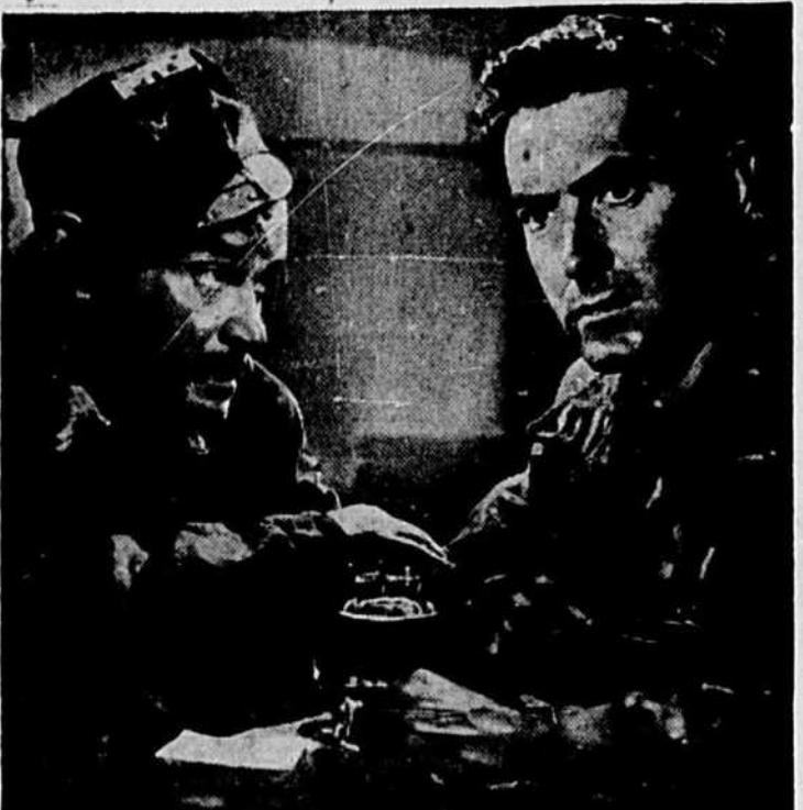
Fritz Kortner et Tyrone Power dans une scène du film "Razor's Edge" qui prendra l'affiche du théâtre Loew's vendredi prochain.