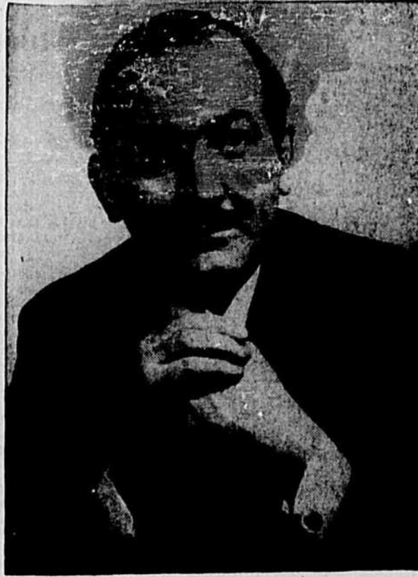
N.-D.-de-Grâce présentera jeudi soir, le 10 avril, à la salle de l'école Notre-Dame-de-Grâce, Mgr Guérin parlera de "Vienne, retour du monde".