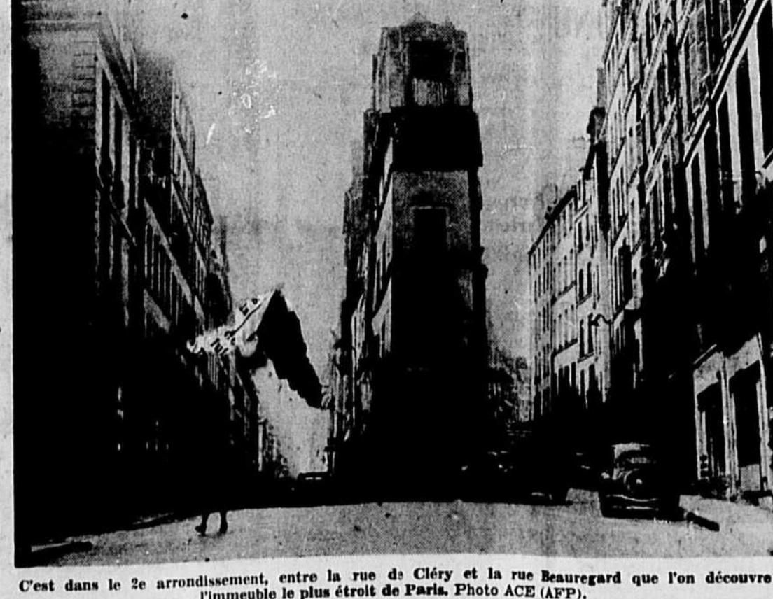
C'est dans le 2e arrondissement, entre la rue de Cléry et la rue Beauregard que l'on découvre l'immeuble le plus étroit de Paris.