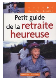
Petit guide de la retraite heureuse par Marie-Paule Dessaint (Canada)