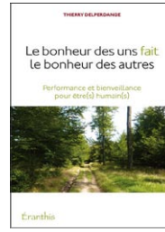
Le bonheur des uns fait le bonheur des autres par Thierry Delperdange (Belgique)