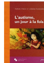
L'autisme, un jour à la fois par Catherine Kozminski (Canada)