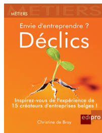
Déclics par Christine Debray (Belgique)