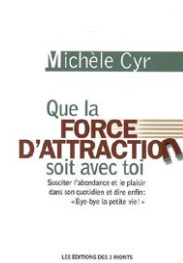
Que la force d'attraction soit avec toi par Michèle Cyr (Canada)