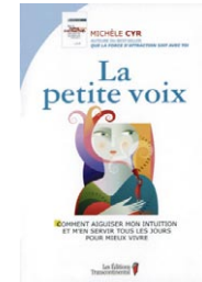
La petite voix par Michèle Cyr (Canada)