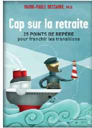
Cap sur la retraite par Marie-Paule Dessaint (Canada)