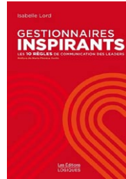
Gestionnaires inspirants par Isabelle Lord (Canada)