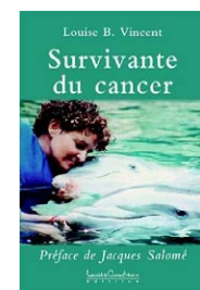
Survivante du cancer par Louise Vincent (Canada)