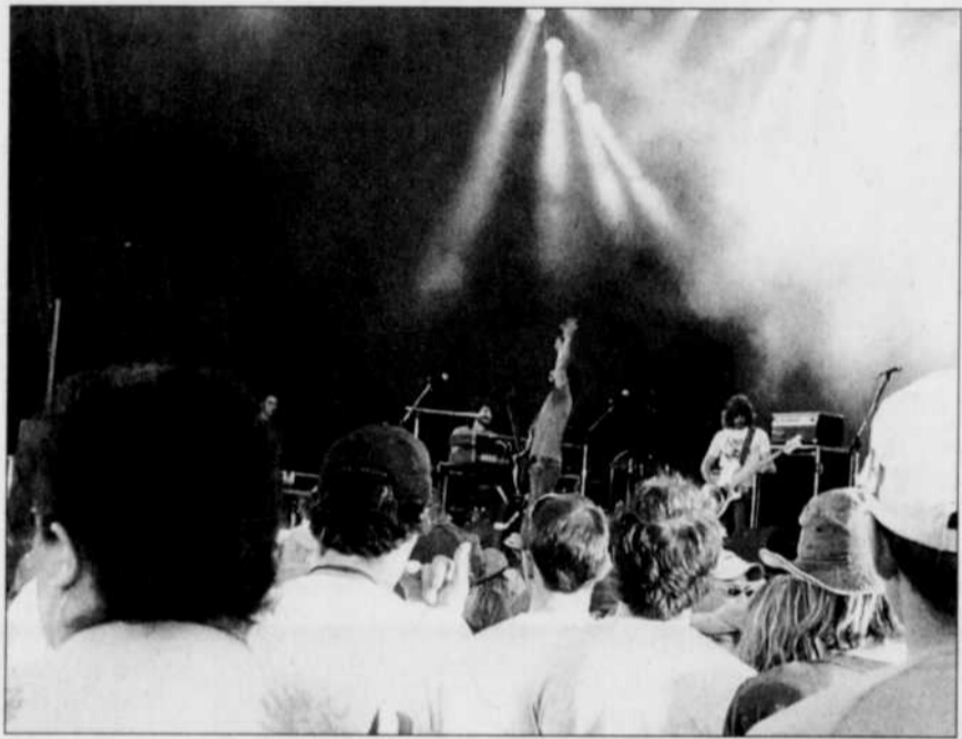
Le spectacle de Sam Roberts... sans parapluie