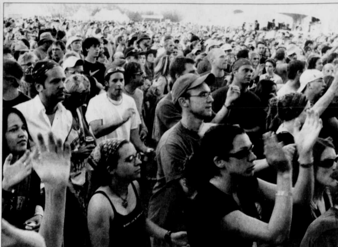
Les participants au 10 e Festival ont «trippé» fort, en «gang».