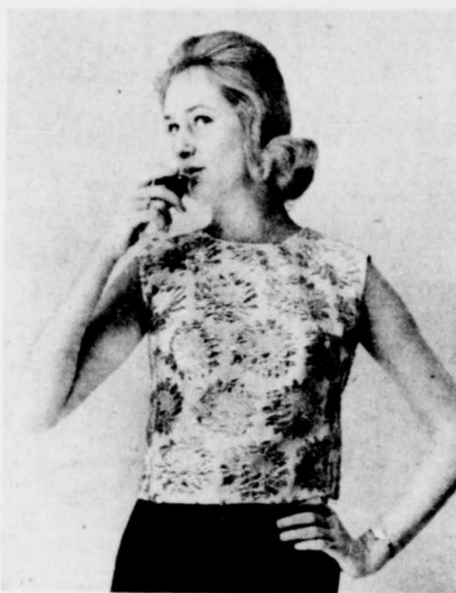
POUR LA JEUNE fille qui travaille, l'ensemble formé par la blouse et la jupe reste toujours le plus confortable, le plus élégant et le plus pratique.