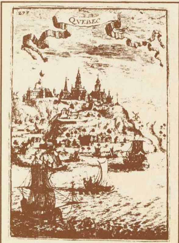
Bibliothèque Nationale du Québec