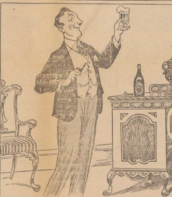
T'AS-PAS ESSAYÉ UNE BLACK HORSE? C'EST LA VÉRITABLE SOURCE D'INSPIRATION.

dites simplement— "Bière Black Horse Dawes s.v.p."