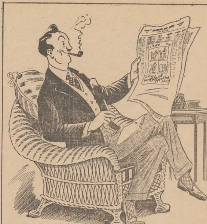
T'AS-PAS DÉJÀ OUVERT TON JOURNAL ET APERÇEUVANT UNE SÉRIE DE "T'A' PAS" PENSE QUE TU POURRAIS EN COMPOSER UNE BIEN MEILLEURE ET TOUT DE SUITE, SORTANT TON CRAYON TU TE METS EN FRAIS—