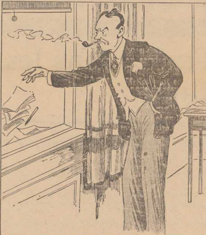
ET DÉGOUTÉ, TU LANCES FINALEMENT PAPIER ET CRAYON PAR LA FENÊTRE.