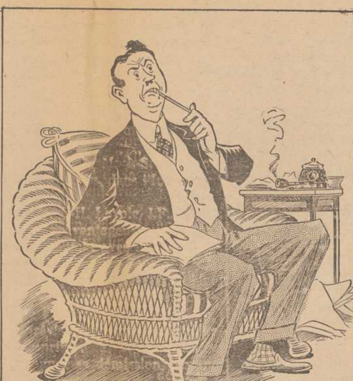
TU ÉCRIS—ET TU TE CREUSES LA TÊTE—PLUS TU ÉCRIS ENCORE QUELQUE CHOSE—DÉCIDÉMENT, CE N'EST PAS SI FACILE—