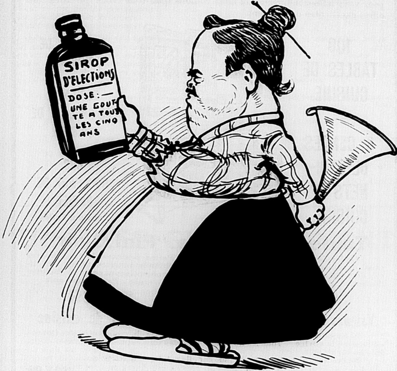
LA MERE GOUIN. — Ah ! mes p'tits agneaux, rien qu'à voir la fiole, ça me donne des coliques.