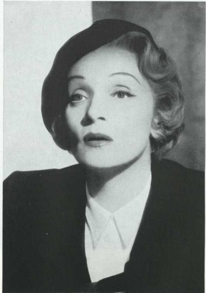
Witness for the Prosecution