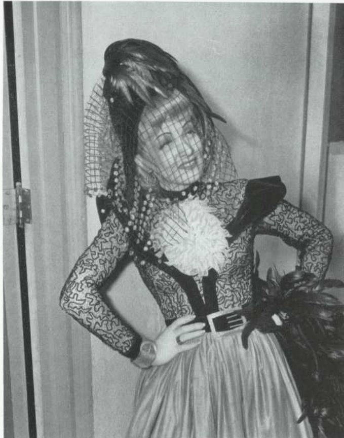
Flame of New Orleans