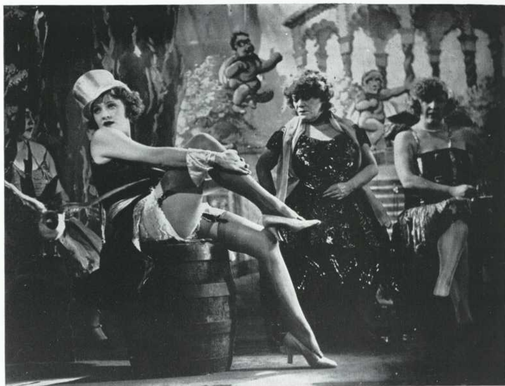
Der blaue Engel