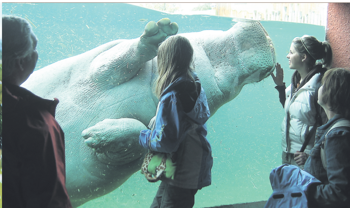
La rivière aux Hippopotames, au zoo de Granby.

R. Oui. C'est de moins ce que prétendent les entreprises sondées. Les produits écoconçus sont plus économiques à l'achat dans 28% des cas, plus économiques à l'usage (25%), plus faciles à utiliser (28%), plus durables (28%). Principal défaut: ils sont rares.