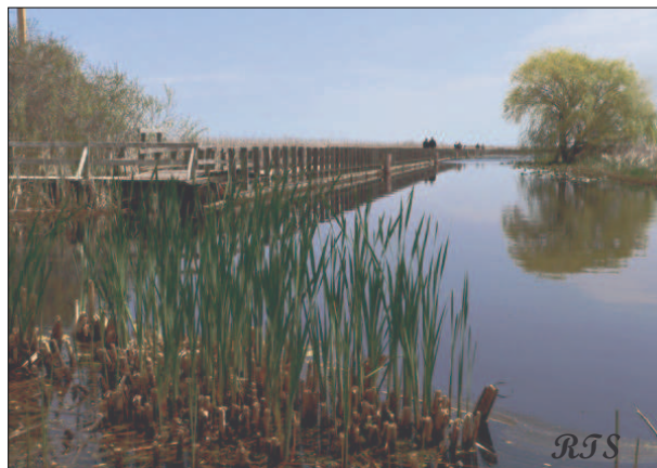
Promenade du marais, Pointe-Pelée, mai 2007