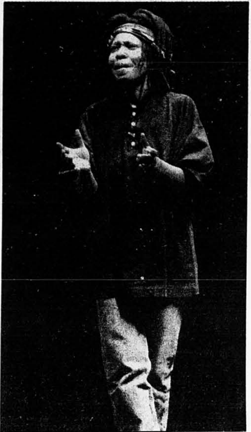
Whoopi Goldberg à la PDA

S'il est vrai qu'on ne peut pas reprocher à une comédienne de profiter de sa popularité pour éveiller la conscience sociale, bien au contraire, il est vrai également qu'il ne faut pas prendre le public pour un débile léger.