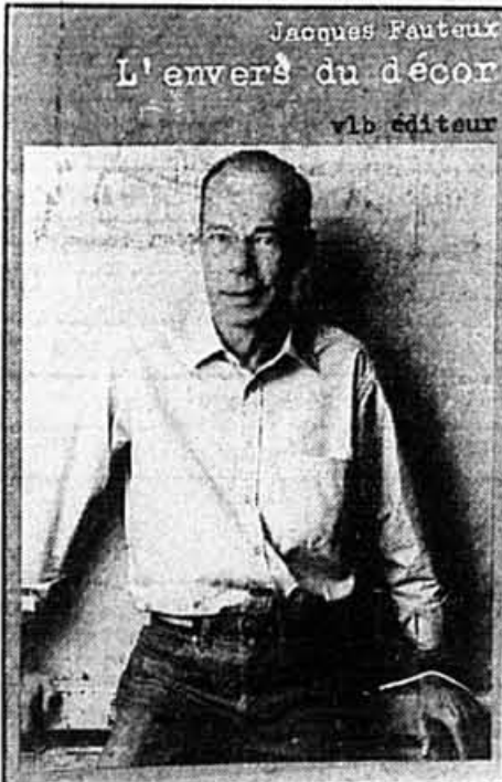
Le livre de Fauteux

Voilà l'objet de L'envers du décor : l'immense désillusion d'un homme