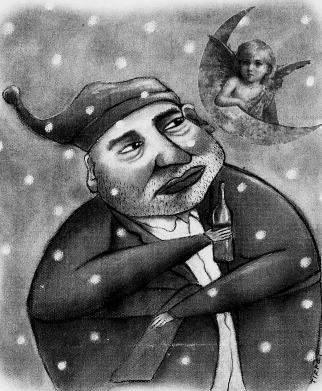
CHRISTIAN TIFLET LE DEVOIR

En plus du gambling désolant avec la vie d'autrui auquel s'adonnent certains parents et médecins, ces ratés démontrent le besoin pressant de poursuivre les recherches pour créer des médicaments qui, une fois pour toutes, ne seront plus des tremplins vers la grossesse multiple.