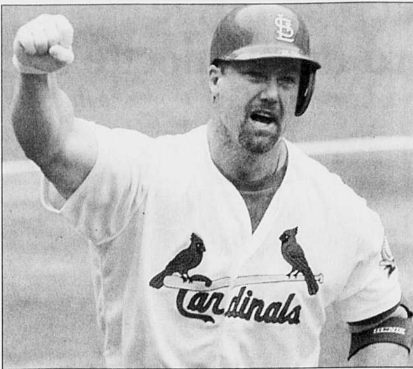
Mark McGwire, après son 70 e circuit

Mais fallait-il en attendre moins d'un vieux routier au bras bionique (David Cone), d'un gaucher bedonnant (David Wells), d'un jeune gaucher talentueux (Andy Pettite), d'un réfugié cubain (Orlando Hernandez) et d'un immigré japonais (Hidaki Irbu)?