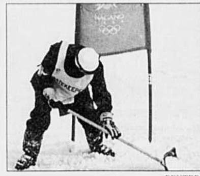
La neige avait tombé durant cinq jours avant les épreuves de ski.

Le deuxième moment fort de la saison est survenu en juin lorsque les Red Wings de Detroit ont remporté la coupe Stanley en battant les Capitals de Washington en quatre matchs. Les joueurs des Red Wings ont offert cette deuxième coupe en deux ans à leur ancien coéquipier Vladimir Konstantinov, victime d'un tragique accident de la route dans lequel le masseur Sergei Mnatsakanov a aussi été grièvement blessé. Konstantinov a fait un tour d'honneur en fauteuil roulant, la cou-